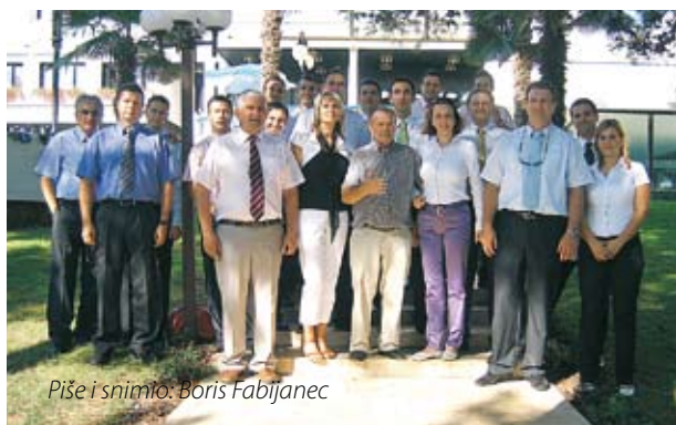
Piše i snimio: Boris Fabijanec

potreba tvornice za koncentratom rajčice iz domaće proizvodnje, na način dužeg trajanja sezone otkupa i prerade koja će zapošljavati ljude i strojeve 40 do 45 dana u kolovozu i rujnu.