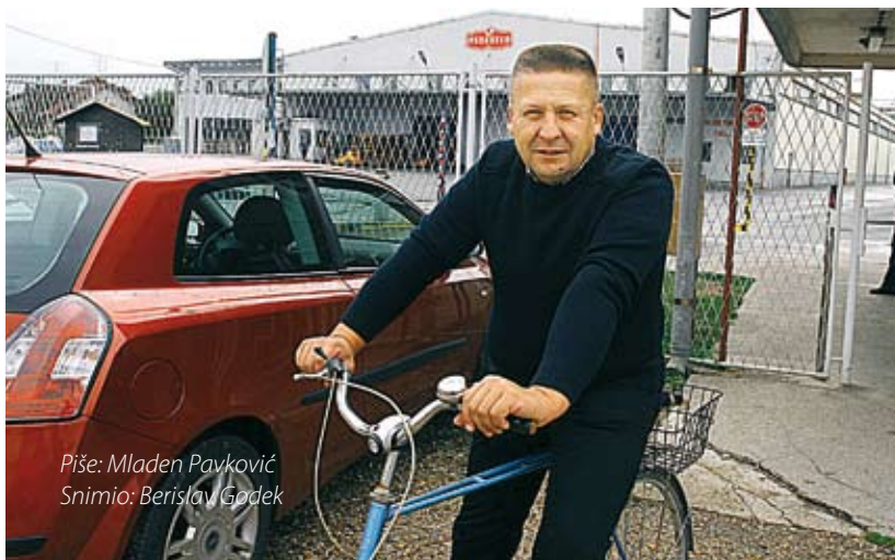
Piše: Mladen Pavković