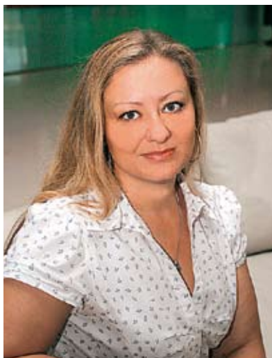
Piše: Ines Banjanin, glavna urednica