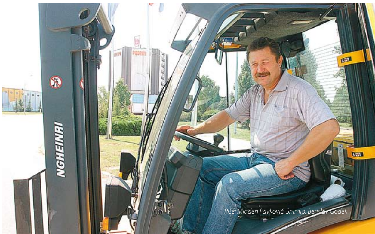
Piše: Mladen Pavković