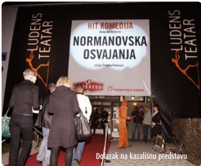
Dolazak na kazališnu predstavu