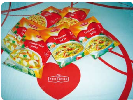
juha u vrećicama. Podravka juhe u vrećicama čini široka pale-

Cilj je kampanje jačanje imidža Podravka bistrh juha, te održavanje poznatosti marke i dominantnog tržišnog položaja