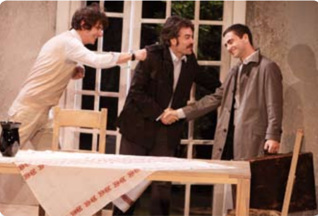
Detalj iz predstave "Normanovska osvajanja"