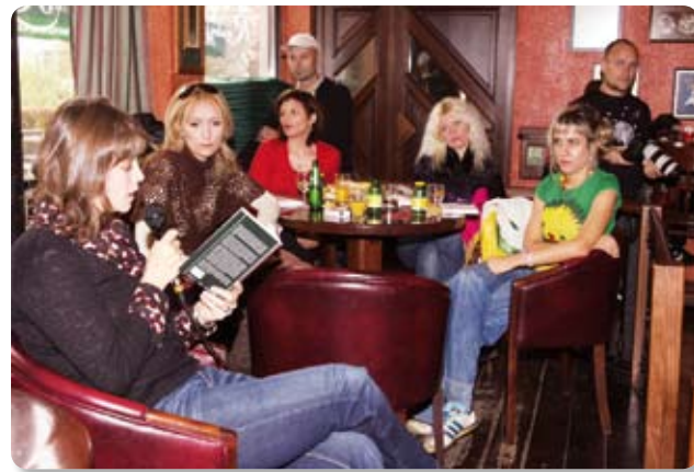
Jutarnja kavica s piscima u koprivničkim kafićima