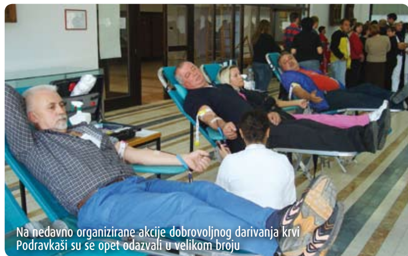
Na nedavno organizirane akcije dobrovoljnog darivanja krvi Podravkaši su se opet odazvali u velikom broju

ganizacije prikupljanja i obrade krvi u skladu s europskim standardima, kojoj je cilj racionalizacija potrošnje krvi i krvnih pripravaka.