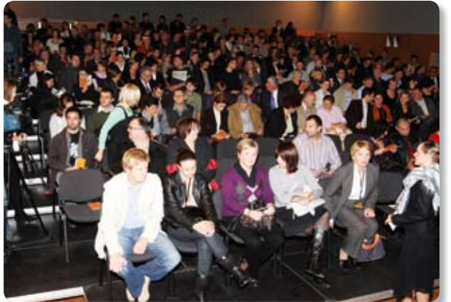
Ljubitelji kazališta ispunili su koprivnički Dom mladih

Dan grada Koprivnice, 4. studenoga, i ove će godine biti obilježen brojnim manifestacijama. Program obilježavanja počeo je već danas, 31. listopada, polaganjem vijenaca Grada Koprivnice ispred Centralnog križa na Gradskom groblju i na grobove za služnih građana, dok će u ponedjeljak, 3. studenoga, biti predstavljen peti broj "Koprivničkog godišnjaka", te će biti održan Koncert Osnovne glazbene škole "Fortunat Pintarić" Koprivnica pod nazivom "Učenici i profesori svome gradu" u Domu mladih. Središnja proslava Dana grada održat će se u utorak, 4. studenoga, kad će biti u 11 sati u Domoljubu održana svečana sjednica Gradskog vijeća Grada Koprivnice na kojoj će biti dodijeljene i godišnje nagrade zaslužnim građanima i institucijama.