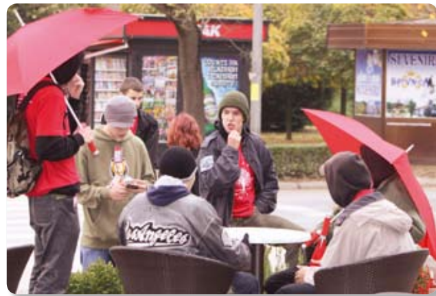
Akcija čitanja građana na G-točkama