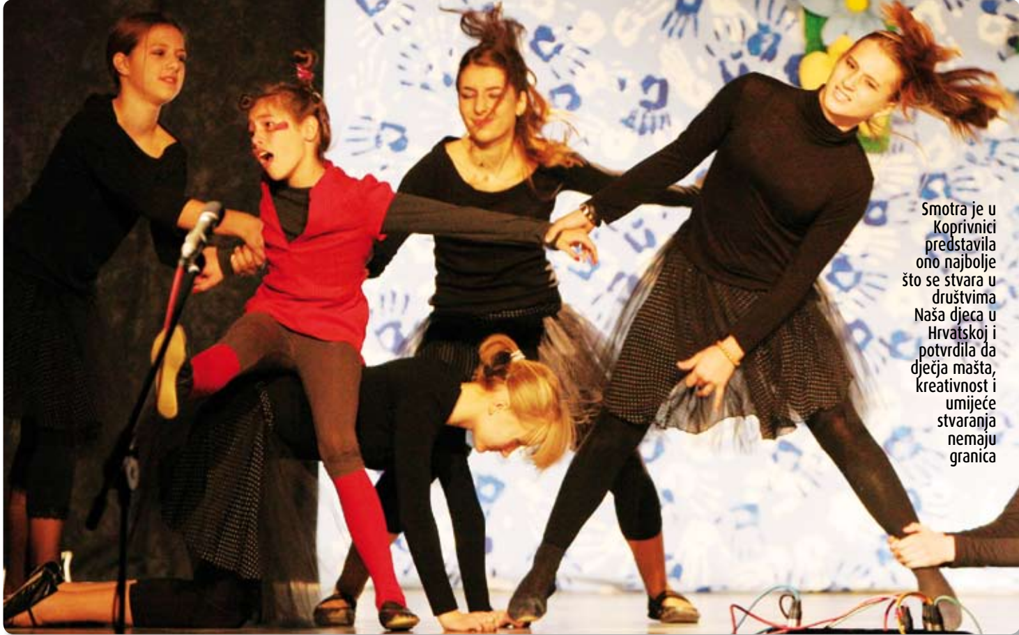
Smotra je u Koprivnici predstavila ono najbolje što se stvara u društvima Naša djeca u Hrvatskoj i potvrdila da dječja mašta, kreativnost i umijeće stvaranja nemaju granica

Smotra je svečano otvorena prošlog petka u Sportskoj dvorani Srednje škole mimohodom sudionika i programom u kojem je sudjelovalo gotovo 400 izvođača iz koprivničkih škola, vrtića i udruga djece i mladih, te djeca iz Virja i Legrada. Njen službeni početak označili su predsjednica Saveza DND Hrvatske dr. Aida Salihać Kadić i gradonačelnik Koprivnice Zvonimir Mršić u pratnji dječaka i djevojčice u renesansnim odorama. Izrazivši zadovoljstvo što je Koprivnica - koja je ugostila 1. Smotru dječjeg stvaralaštva 1993. godine - domaćin i 15. jubilarnog druženja djece, gradonačelnik Mršić - Uvjeren sam da će Smotra pokazati ono najbolje što raste u dječjim srcima i mašti, te da će Koprivnica još jednom potvrditi ne samo da je grad prijatelj djece nego i grad gostoljubivih ljudi. A to se i dogodilo. Smotra je bila najmasovnije i najsadržajni-