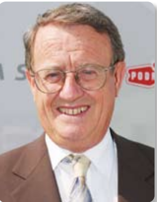
Piše: dr. Ivo Belan

Kad je u pitanju alkoholizam, neki su ljudi osjetljiviji od drugih, međutim za svakog je opasno nadati se da ima neku vrst "ugrađenog" imuniteta. Ipak, oni koji su svjesni opasnosti alkohola mogu ih lako izbjeći.