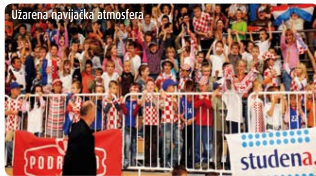
Užarena navijačka atmosfera

Maks su visoko uzdignutih ruku proglašeni najboljima. Sada sanjaju veliko finale, a njihovi prijatelji iz škole mogućnost ponavljanja Čokolino višebojca u sljedećoj sezoni. Jer zbog odlične organizacije i navijačke atmosfere OŠ "Milke Trnine" iz Križa (Zagrebačka županija) uvrštena je u krug onih koji mogu ponoviti domaćinstvo Čokolino višebojca. J. Lakuš