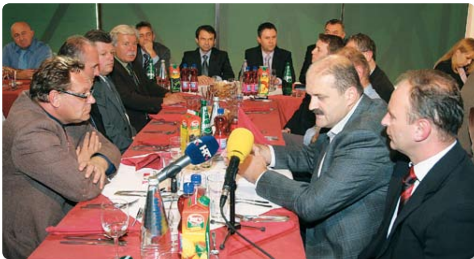
Sa sjednice Poslovnog kluba HGK - Županijske komore Koprivnica

Podravka, Belupo, Mlinar, Rasco i Sizim doniraju po 20.000 kuna godišnje od 2008. do 2012. Ove donacije će se isključivo iskoristiti za stipendiranje studenata i učenika deficitarnih struka i stručnjaka koji će pridonijeti unapređenju gospodarstva u Županiji