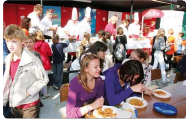
Podravkini promotori kulinarstva za sudionike smotre priredili su različite degustacije naših proizvoda