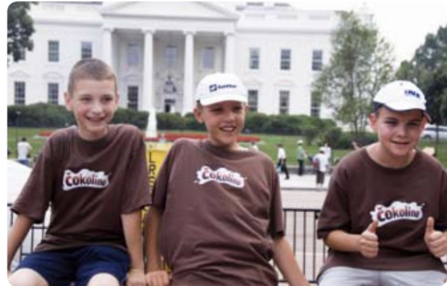
Snimka ispred Bijele kuće - u majicama Čokolina - dječacima iz Zagreba zauvijek će ostati lijepa uspomena

Prošlog petka na Šoderici su sedmi put održani tradicionalni sportski susreti triju sindikata koji djeluju u Belupu, a ovaj put "pobijacima" i s predstavnicima braniteljske udruge Podravke. Na prigodno organiziranom turniru u malom nogometu nastupile su ekipe HUS-a, PPDIV-a, SINPOD-a i UBIUDR-a. Poslije održanih zanimljivih malonogometnih utakmica, koje su bile pravo sportsko odmjerenje snaga, najuspješniji su bili nogometaši članovi PPDIV-a koji su uvjerljivo osvojili prvo mjesto. Kako nam je ispred organizatora ovogodišnjih sindikalnih susreta, HUS-a Belupa, rekao Ivica Blažek, cilj je i ovih susreta, kao i svih dosadašnjih godina, bio da ljudi budu zajedno i da se druže u opuštajućoj atmosferi. Stoga je poslije sportskog dijela druženje Belupovaca nastavljeno zajedničkom večerom i veselimom uz muzički sastav "Pan". Susretima je nazočio i predsjednik Uprave Belupa Stanislav Biondić koji se prigodnim riječima obratio nazočnicima, te podijelio pokale najboljim ekipama za postignute rezultate. V. I.