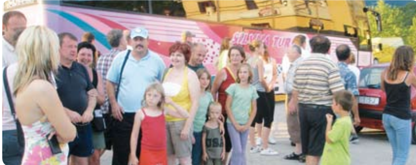
Podravkini branitelji sa svojim obiteljima stigli su u Opatiju

Inače, Podravkina udruga je do sada već organizirala takve i slične izlete za svoje članove te su branitelji Podravke do sada posjetili Pulu, Zadar, Crikvenicu, Šibenik i druge gradove, a interes je uvijek bio iznad očekivanja. Tako se i za ovaj izlet u Opatiju javilo više od 500 Podravkinih radnika. MI. P.