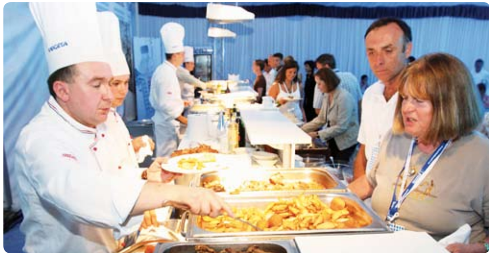
Podravkini promotori kulinarstva pobrinuli su se za - dobru hranu