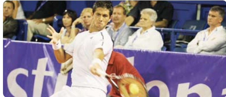
Ovogodišnji pobjednik umaškog turnira je Španjolac Fernando Verdasco