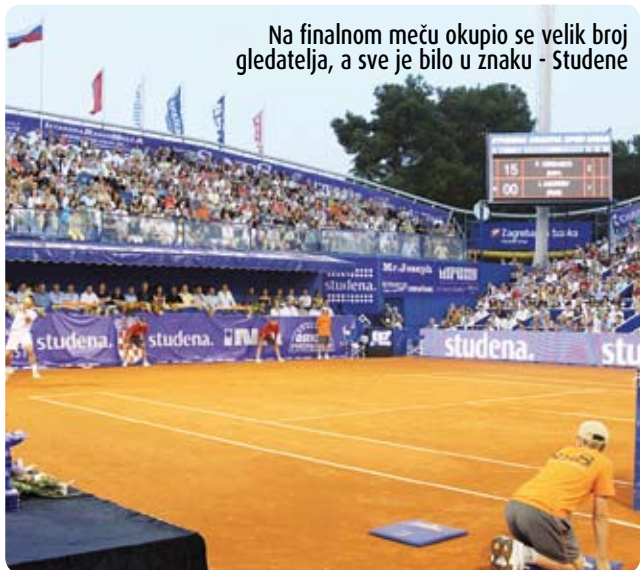
Na finalnom meču okupio se velik broj gledatelja, a sve je bilo u znaku - Studene