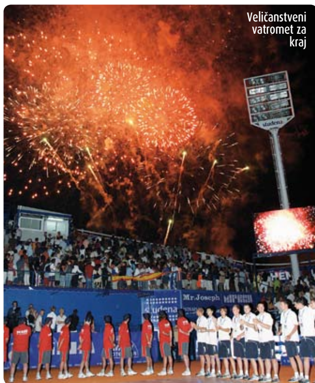
Veličanstveni vatromet za kraj