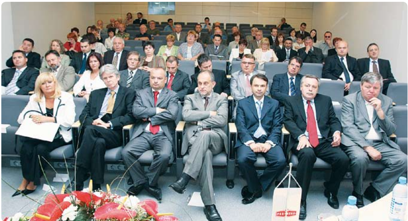
Održana Glavna skupština dioničara Podravke d.d.

Na potonje će trendove utjecati i Vlada, koja je na jednoj od posljednjih sjednica, nakon odluke o subvencioniranju plavog dizela iznad pet kuna, odlučila pokrenuti akciju preispitivanja trgovačkih marži. Nemali je, naime, broj onih koji su poremećaje u cijenama sirovina iskoristili i za dizanje marži tamo gdje nije bilo razloga. Vlada je uputila korisnicima proračuna još jednu iznimno važnu poruku. Valjane argumente za dizanje cijena, napomenuo je premijer Ivo Sanader, nemaju proizvođači koji dobivaju državne poticaje, tim više što su oni ove godine i uvećani u odnosu na prijašnje razdoblje. Oni koji to ne shvaćaju morat će se odrediti potpora iz države blagajne. Kad tomu ne bi bilo tako, država bi sama podupirala rast inflacije. ■