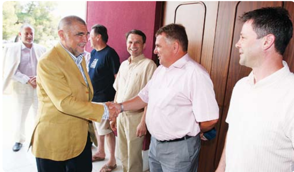
Predsjednik Republike Hrvatske Stjepan Mesić pozdravio se s čelnim ljudima Podravke

Umag je u vrijeme turnira destinacija na koju brojne ličnosti iz političkog, gospodarskog i društvenog života Hrvatske dolaze u taj prelijepi istarski grad. Usporedno sa teniskim uzbuđenjima, tradicionalno je održan izbor najljepše hostese, mnogobrojni koncerti, domjenci, prezentacije, svakodnevnice zabave i još mnogo toga što iz godine u godinu u Umag privlači brojne domaće i strane goste. Činjenica je da od prve subote turnira, pa sve do blistavog nedjeljnog vatrometa, na centralnom stadionu i oko njega, sve je bilo puno ljudi željnih zabave, a domaćini su se tradicionalno i ove godine potrudili da svatko može pronaći nešto za sebe. B. Fabijanec