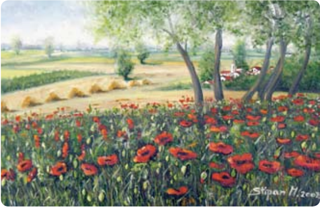
Cvjetne livade Marije Stipan privlače pozornost

Izložba u spomenutoj galeriji bit će otvorena narednih mjesec dana. N. Z. L.