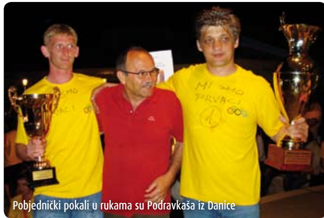
Pobjednički pokali u rukama su Podravkaša iz Danice

Izboreno je prvo mjesto u nogometu i drugo mjesto u odbojki i to je bilo dovoljno za sveukupnog pobjednika. Danica d.o.o. je prvi puta