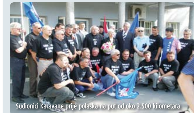
Sudionici Karavane prije polaska na put od oko 2.500 kilometara

Trideset i šest hrvatskih branitelja, od 27. - 31. svibnja, pod pokroviteljstvom Ministarstva obitelji, branitelja i međugeneracijske solidarnosti i Ministarstva zdravstva i socijalne skrbi, a u organizaciji Udruge branitelja, invalida i udovica Domovinskog rata Podravke, Udruge branitelja Ine-Naftaplina i Udruge hrvatskih liječnika dragovoljaca Domovinskog rata sudjelovalo je na tradicionalnoj Karavani "Da se ne zaboravi - 2500 kilometara diljem Hrvatske".