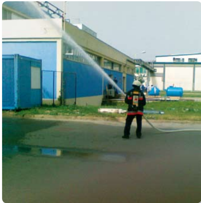
Uspješnom vatrogasnom vježbom na Danici završen Mjesec zaštite od požara