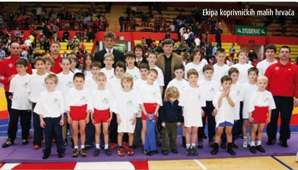
Ekipa koprivničkih malih hrvača