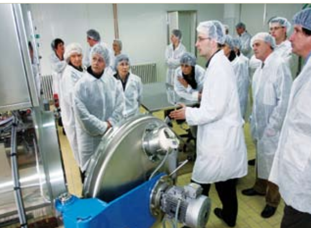
Profesori s PBF-a sa zanimanjem su razgledali novi Podravkin poluindustrijski laboratorij

- Dionice Podravke listane su na Službenom tržištu Zagrebačke burze i dostupne su svim ulagačima pod jednakim uvjetima. Podravka je do sada na burzi kupovala kompanijske dionice za potrebe vlastita trezora, u skladu s odlukom Skupštine dioničara.