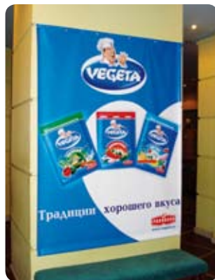
Reklamni pano u kazalištu "Komedija" u Novgorodu

Посещение 17 января ресторана-пивоварни «БирМания» и мастер-класс шеф-повара стали очередным этапом подготовки Всероссийского Фестиваля невест. Конкурсное задание «Блюдо для любимого мужа» обязало быть зрелищным на сцене театра «Комедия». Молодые хозяйки старательно вырезали причудливые узоры из овощей. Этот мастер-класс стал отличной подготовкой к феерическому кулинарному шоу 14 февраля.