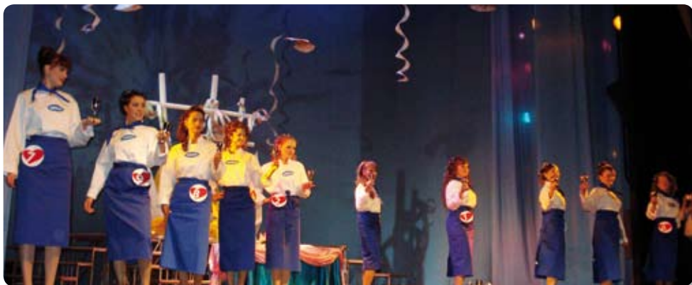
Natjecateljice su nosile Podravkine kuharske odore, a u pripremanju jela koristile su - Vegetu

Rijetko smo u prilici u našim novinama zabilježiti postignuća naše ekipe Podravkaša u velikoj Rusiji. Akciju koju su oni proveli na Dan zaljubljenih, popularnije zvanom Valentinovo, u N. Novgorodu u svakom je pogledu hvalevrijedna. Naime, Podravkino predstavništvo bilo je jedan od glavnih sponzora "Festivala nevjesta", kulinarско-scenskog natječaja djevojaka koje su u prošloj godini sretno zaplovile u bračnu luku.