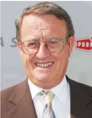
Piše: dr. Ivo Belan

Tražiti prosječnog čovjeka među ljudima može biti nastojanje spuno neispravnosti i manjkavosti, jer svaki od nas je jedinstveni primjerk. Svaki od nas sazdan je na izrazito različiti način u svakoj pojedinosti i to je temelj individualnosti. Dobro je poznato, primjerice, da svaka osoba ima specifičan otisak prstiju i prirodan miris, dovoljno razlikovan da pas izvrsnog njuha može tragati za njim.