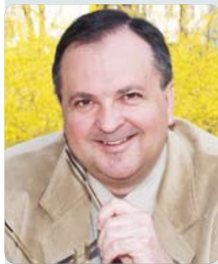
Piše: Željko Krušelj

Sudeći prema dostupnim informacijama, Eurostat je u načelu otvoren za preinake regionalnih granica, ali iza njih bi trebala čvrsto stati nova Vlada u završnim pregovorima o članstvu s Europskom komisijom