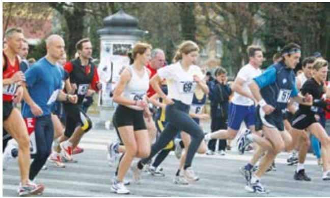
Utrka grada Koprivnice