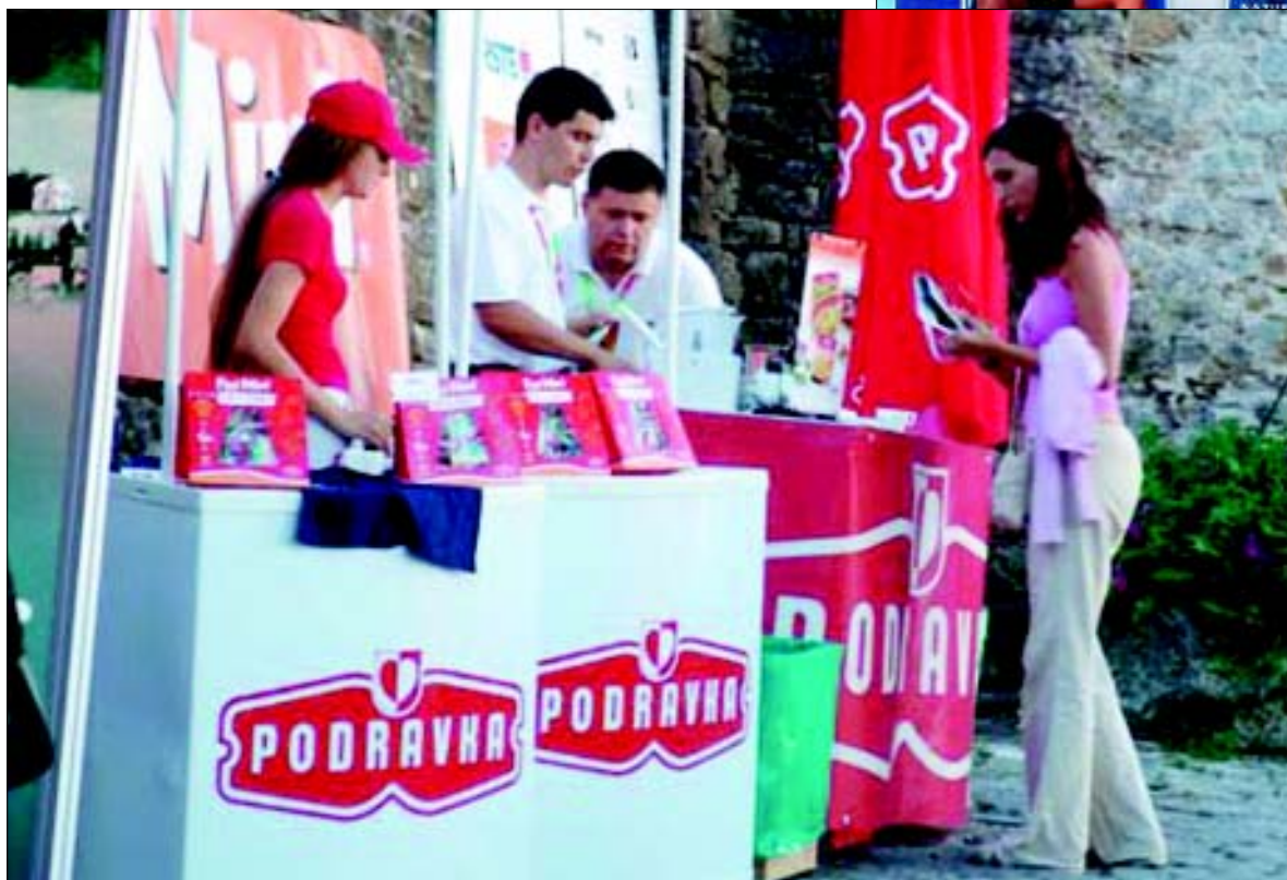
Podravkine Fini-Mini juhe odlično su se uklopile u atmosferu filmskog festivala u Motovunu

visnim produkcijama, prije svega filmovima nastalim u drugim zemljama. Ove godine posjetitelji su vidjeli osamdesetak filmova iz različitih svjetskih produkcija. U suštini festival je izrazito neformalnog karaktera, a upravo takav pristup stvorio je jedinstvenu opuštenu atmosferu, koja je postala zaštitnim znakom festivala.