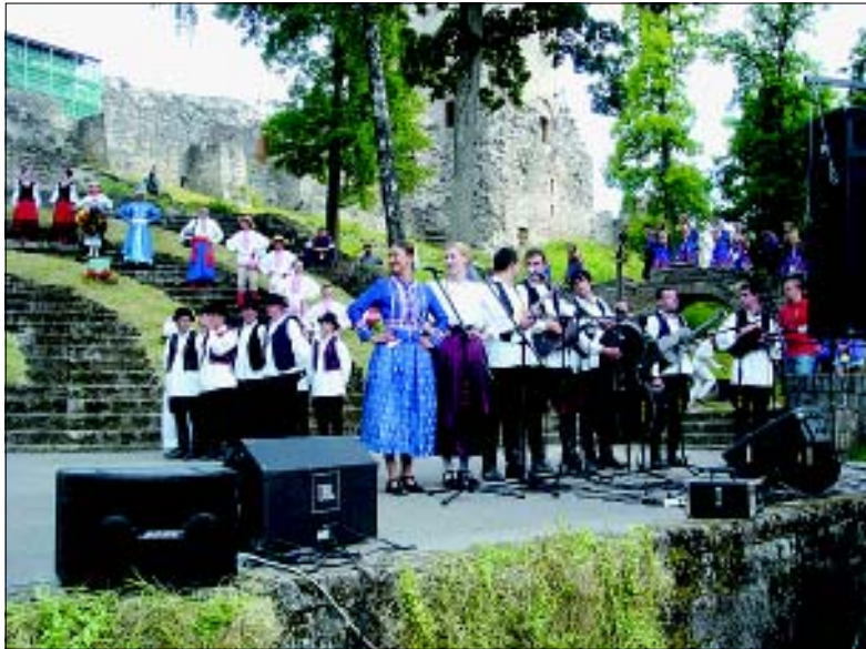
Pozornica ispod stare kule u gradu Cesisu idealna je za odličan nastup

A zatim su uslijedili nastupi. Plesalo se na pozornici uz ušće jedne od 12 tisuća latvijskih rijeka u najveći vodotok Daugavu u mjestu Plavinjasi u kojemu je svaki četvrti stanovnik član nekog kulturno-umjetničkog društva, a koliko im je glazba prirasla srcu potvrdili su izvođači i jednu pjesmu na vrlo korektnom hrvatskom. Zvukovi glazbe iz različitih zemalja razli-