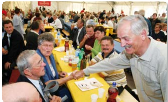
Pozdrav starih prijatelja i znanaica s posla

Piše: Vjekoslav Indir