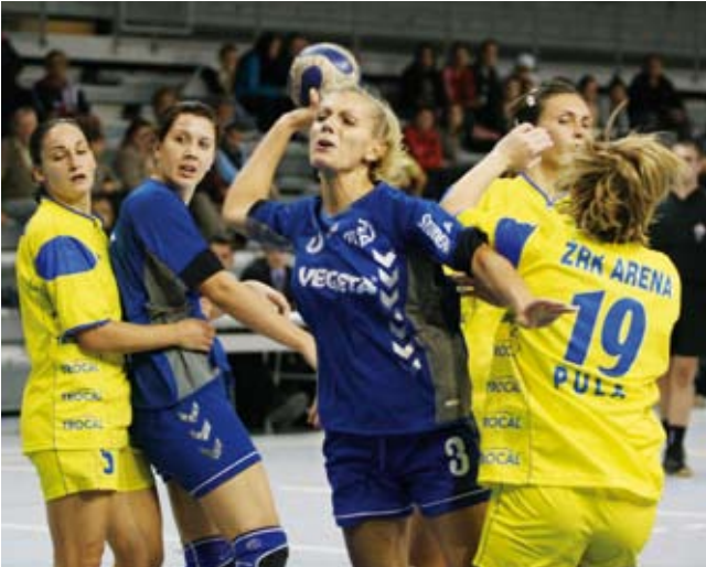
Protiv “ozbiljne” ekipe Arene razlika je bila 27 golova

Podravka je počela utakmicu prilično nespretno s nekoliko promašaja, ali ubrzo je to