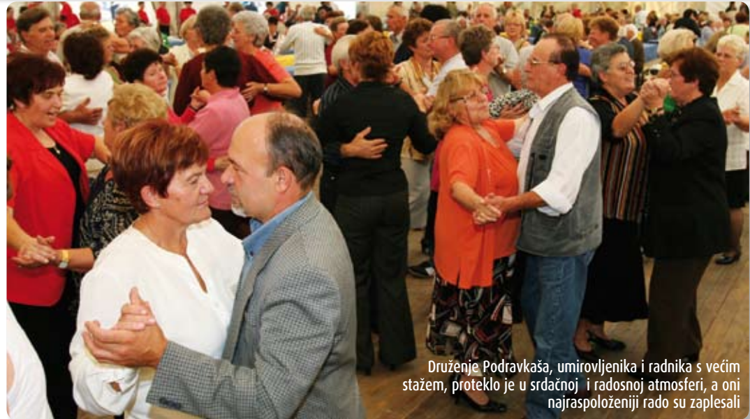
Druženje Podravkaša, umirovljenika i radnika s većim stažem, proteklo je u srdačnoj i radosnoj atmosferi, a oni najraspoloženiiji rado su zaplesali