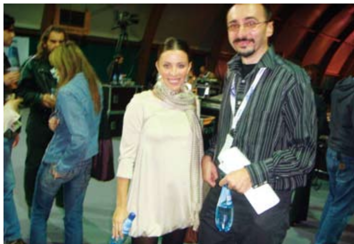
Studena je postala već uobičajeni "gost" na raznim događanjima

Studena se pridružila i podržala ovu humanitarnu akciju te svim gostima eventa ponudila osvježenje i dobru zabavu. K. M.