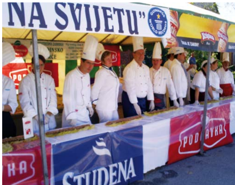
Podravkini promotori kulinarstva, zajedno s istaknutim članovima Hrvatskog kuharskog saveza, tradicionalno sudjeluju u izradi mega - sarme

kxi sarme, organizira i natjecanje novinara u pripremanju jela od zelja, pa tako i promotori kulinarstva zajedno s kolegama iz cijele Hrvatske sudjeluju u ovoj zanimljivoj promotivnoj akciji. Ove godine naišli smo na izuzetno velik interes posjetitelja, koji su nekoliko sati čekali u redu kako bi isprobali omiljeni specijalitet. Dobili smo pohvale i za okus i za izgled sarme, što je nama Podravkašima bilo posebno drago jer je većina namirnica korištenih za izradu bila upravo iz Podravke - rekao nam je Dražen Đurišević. J. L.