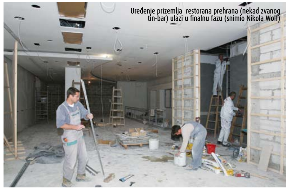
Uređenje prizemlja restorana prehrana (nekad zvanog tin-bar) ulazi u finalnu fazu

Dakle, strateškim promišljanjem, dobrom koordinacijom, financijskom analizom i procjenom, sustav intelektualnog vlasništva treba stalno razvijati tako da se omogući da intelektualno vlasništvo ulazi u procjenu vrijednosti tvrtke i tako na kraju povećava imovinu dioničara - rekao je Vukman. ■