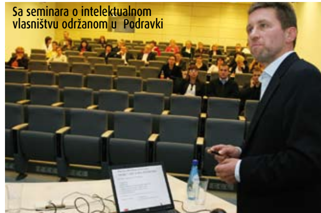
Piše: Jadranka Lakuš

Među brojnim sponzorima konferencije je i Podravka. I. B.