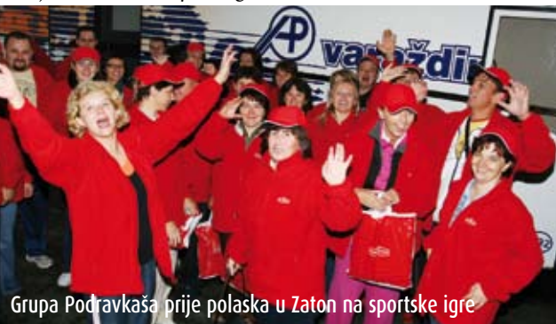
Grupa Podravkaša prije polaska u Zaton na sportske igre

Zaton pored Zadra od četvrtka 27. do nedjelje 30. rujna mjesto je na kojemu se prvi puta okupilo više od 1000 Podravkaša na prvim Podravkinim korporativnim sportskim igrama. Tako će Podravkaši dobiti prigodu odmjeriti snage u raznim sportskim disciplinama poput malog nogometa, košarke, odbojke na pijesku, pikadu, potezanju konopa i u beli. Već danas se najavljuje kako će ove Podravkine korporativne sportske igre postati tradicionalne. Podravkine korporativne sportske igre postat će i svojevrsno mjesto susreta Podravkaša iz svih cjelina i tvornica iz Hrvatske, kao i Podravkašima iz inozemnih podružnica. Cilj ovih korporativnih sportskih igara je razvijanje timskog duha među radnicima jer su ljudi najvažniji element svake moderne kompanije pa tako i Podravke. Jedino su ljudi ti koji pospiješuju svaku efikasnost i ostvaruju poslovne rezultate. Na jednom mjestu naći će se tako veliki broj radnika Podravke koji će na taj način imati priliku družiti se, opustiti se od svakodnevnih prenatpanih radnih obveza. Za sve Podravkaše koji sudjeluju na igrama, osiguran je organizirani prijevoz autobusima te smještaj u apartmanima turističkog naselja Zaton Holiday Village. V. I.