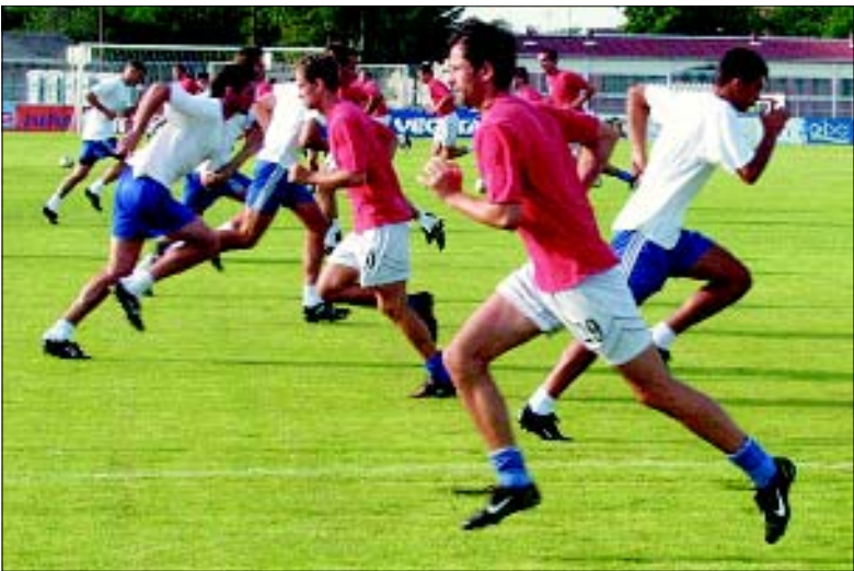
Pripreme Slavenaša na Gradskom stadionu