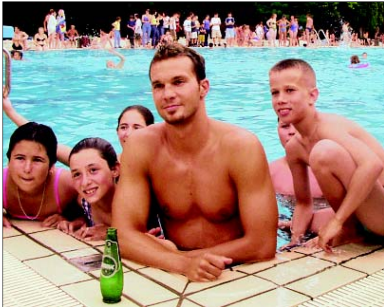
Plivanje s Gordanom djeci iz Lipika više nije samo san

Da je ovdje bio bilo tko drugi od sportaša reagirali bi jedanko. A što se mene tiče, nikada mi nije problem komunicirati s djecom, dijeliti potpise, simpatične su mi njihove reakcije, jer kad jedno dijete ima potpis odmah to želi i drugo. Lijepo je kad se vesele, pa kad vidim da se djeca raduju što im posvjećujem dio vremena ja to činim bez obzira na druge obveze.