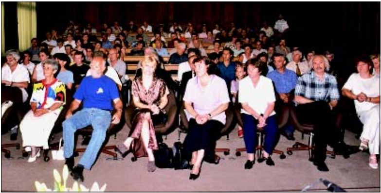
Godišnjoj skupštini Kluba liječenih alkoholičara prisustvovali su i brojni gosti

Apstinentima su uručene prigodne zahvale, a članovi Literarne sekcije KUD-a Podravka i ovom su prilikom priredili mali recital.