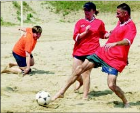
U revijalnoj nogometnoj utakmici žene su bile - bolje