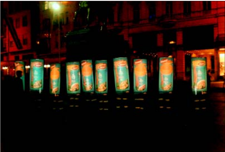
Pokretni svijetleći plakati na Trgu bana Jelačića u Zagrebu uspješno su reklamirali Vegetu twist za posipavanje