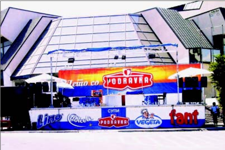
Detalj s prošlogodišnje uspješne kampanje u Makedoniji

Kompletnu kampanju realizira agencija za propagandu i marketing OZEHA - Skopje.