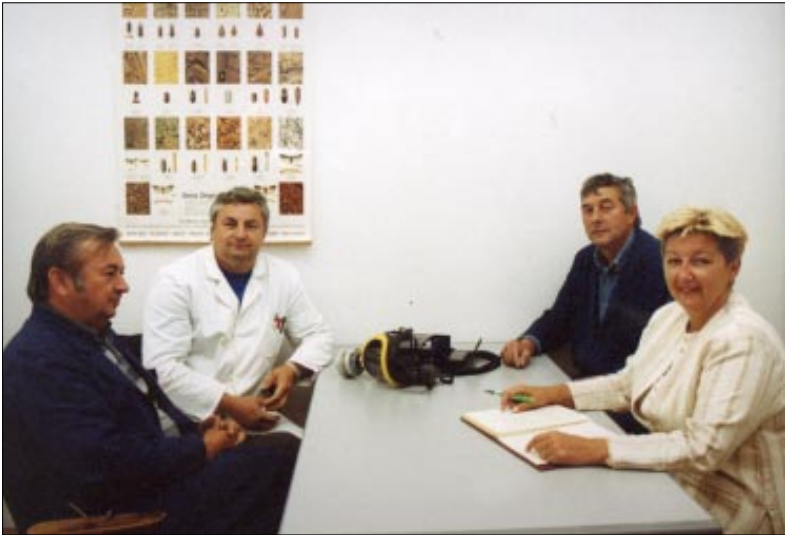
Na slici N. Wolfa: detalj iz adaptiranih prostora koji će umnogome olakšati rad zaposlenika Odjela DDD