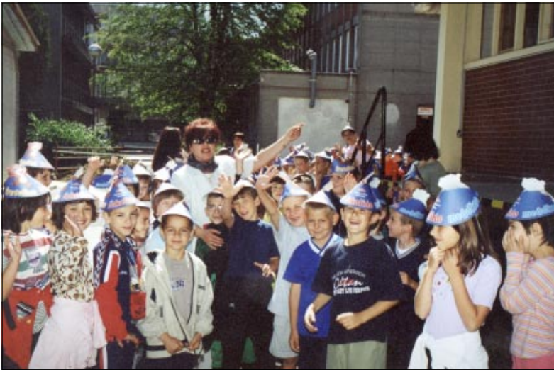
Velik broj djece raznih uzrasta s veseljem dolazi u Podravku

Osim posjeta tvornicama često su tu i neke druge interesantne destinacije kao Muzej prehrane, skladišta, vatrogasna služba i sl. "Padne" tu i neka zajednička fotografija sa šarenim i omiljenim Lino šeširićima na glavi, a da se ne govori o tome kolika pisma zahvale stižu zajedno s raznim "umjet-