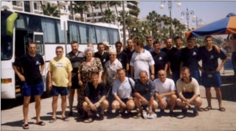
Dio igrača i vodstva kluba s navijačima iz Koprivnice u središtu Larnake

Kontru je nakon kornera domaćih povukao Geršak po lijevoj strani, te na rubu protivničkog šesnaesterca ubacio loptu nisko prema sredini. Mužek je loptu propustio do Jurčeca, koji je do-