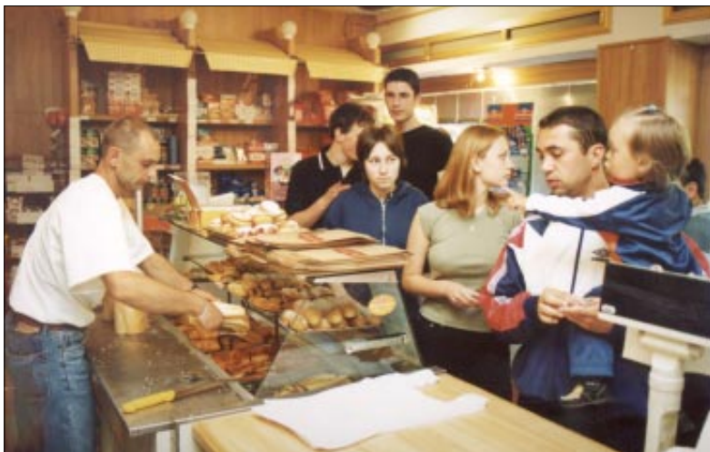
Na slici N. Wolfa: Svakodnevno kupci mogu u "Kifli" kupiti upravo pečene slasne pekarske proizvode

Obično Podravski mlinovi postavljaju jednu termoventilacijsku peć na prodajnom mjestu, a u "Kifli" se već javlja potreba i za drugom. Podravkine stručnjaci u nekoliko dana obučavaju prodavače kako se obavlja taj posao i do sada nije bilo nikakvih problema u tom poslu.