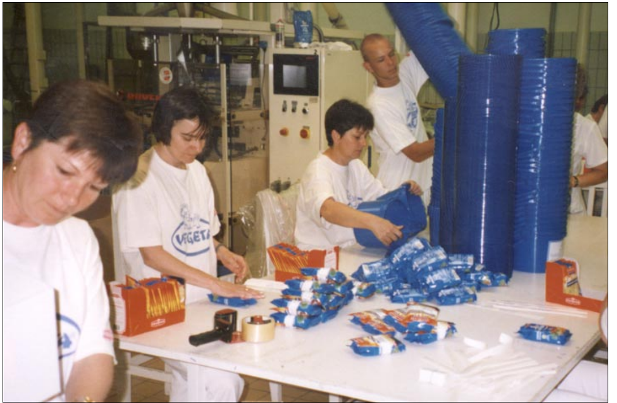
U Mohaču se Vegeta proizvodi za cjelokupno mađarsko tržište, te počinje proizvodnja za bugarsko i rumunjsko tržište

Proizvodi naše tvornice u Mohaču plasiraju se diljem Mađarske. Među-