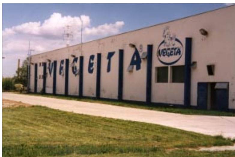
Tvornica u Mohaču zapošljava trenutno devedesetak zaposlenih

- To je i razumljivo. Naime, juhe i slične proizvode možete naći i od drugih, svjetskih proizvođača, dok je Vegeta ipak samo jedna!