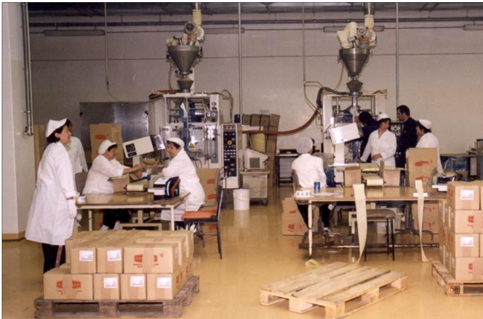
Najnovija transakcija dionicama ponovno je aktualizirala temu radničkog dioničarstva u Podravki