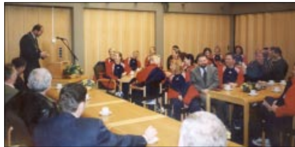
Prijem kod gradonačelnika Wognuma

Još jedan u nizu "atraktivnih" susreta u Prvoj A ligi rukometašica odigran je u srijedu u Koprivnici u okviru 11. kola. Varaždinkama je bilo važno da se ne obrukaju u Koprivnici. I nisu se, mada rezultat od osam golova prednosti za Podravku Vegetu govori o njihovoj nadmoći, ali ne baš prevelikoj. Opet je u glavama Podravkašica proradilo "lako ćemo", a to su djelomično iskoristile poletne Varaždinke, no razlika u kvaliteti ekipa bila je ipak na strani Podravke, koja je igrala u sastavu: Stančin, Vresk 5, Popović, Perčulija, Pensa, Palčić 4, Hodak 4, Raguž 2, Čuljak 4 (1), Čuljak 4 (2), Mihoci 3 (1), Hrg 2 (1) Sirovec 1, Jurić 3, Knezović. IS, PJ