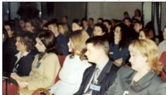
Mladi Podravkaši sa zanimanjem prate predavanje

Prema kvaliteti dobivenih informacija i odgovora na postavljena pitanja, svojom profesionalnošću, znanjem i iskustvom su se posebno istaknuli gospodarstvenici, dakle ljudi koji već dugu niz godina rade u praksi.