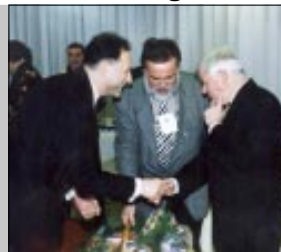
Podravka sponzor izbora Slovenca desetljeća

Predsjednik Uprave Darko Marinac uručio poklon predsjedniku Slovenije Milanu Kučanu 4. str.