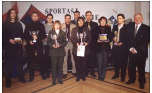
Zajednička slika svih najboljih sportaša