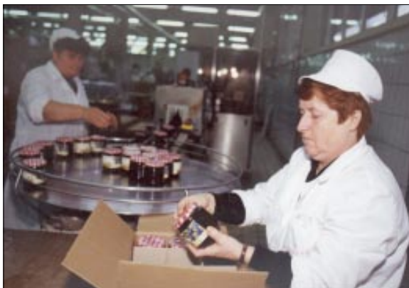
Poznati proizvodi Tvornice voće - pekmezi, marmelade i džemovi - traže nova tržišta

- Potrebna nam je hladnjača s tri velike komore za čuvanje namirnica u različitim uvjetima. No, pitanje je da li to treba biti investicija isključivo samo "Podravke" ili grada i regije. Grad bi za nešto takvoga u svakom slučaju trebao dati besplatnu lokaciju... rekla je Balija i nastavila: - Što se tiče zapošljavanja,