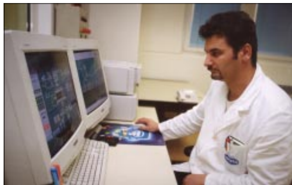
Središnje mjesto za vođenje i nadzor proizvodnje

- Ne bih ništa mijenjao, možda bih još hrabrije "ušao" u visoku tehnologiju. Koliko god smo se bojali kako će ljudi usvojiti upravljanje s ovako složenim sistemom, pokazalo se da je to išlo jako brzo, da nismo imali problema - išli smo korak po korak i ljudi su sve brzo prihvatili.