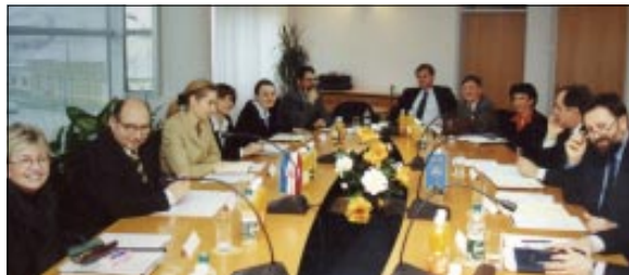
Ministar Božo Kovačević u radnom posjetu Koprivnici

List dioničkog društva "Podravka" Koprivnica