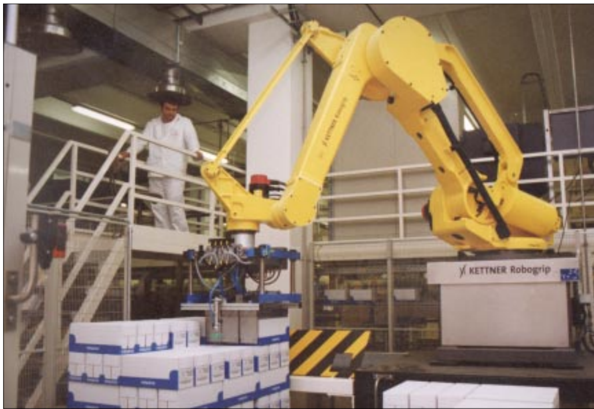
U novoj tvornici "Vegete" - "projektiranoj za 21. stoljeće" - dio poslova obavljaju roboti