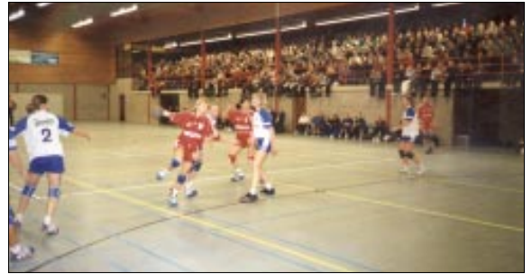
U Nizozemskoj poraz čak od šest razlike!

U Beču se u utorak dogodilo ono što su svi priželjkivali: izvučen je objektivno slabiji protivnik iz Turske, jer osim Slovenki iz Pirana teško da bi se mogao naći lakši protivnik. Podravka Vegeta bila je miljenica sreće, smiješi joj se četvrtzavršnica. Prva utakmica u Turskoj igra se 10. veljače, uzvrat tjedan dana