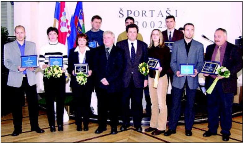
Najbolji sportaši Koprivničko - križevačke županije u prošloj godini

najbolje su organizatori pripremili prigodna priznanja.