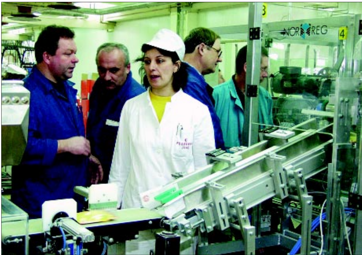
Prva automatska pakerica stigla na Juhe

Tvornici juha. Jedna je potpuno preuređenje pogona okruglica, a druga, u tijeku, jest montiranje prve automatske pakerice u Tvornici, koja s radom počinje ovih dana. Ona će se, doduše, preseliti u novu tvornicu, ali će služiti za obuku ekipe što će je opsluživati.