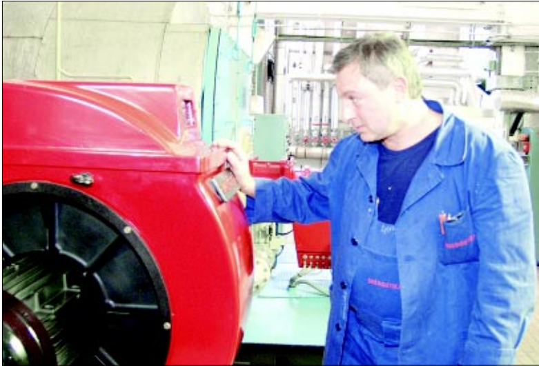
U Podravkinoj kotlovnici ove je zime sve OK

poznato hoće li Dalkia od Podravke kupovati paru ili će ući u projekt vlasti-te kotlovnice za zgrade na Tomislavo-vu trgu, vrtića i zgrade srednjih škola. Više će se znati polovicom veljače, dokad bi gradska vlast trebala raspisati natječaj za koncesiju na grijanje.