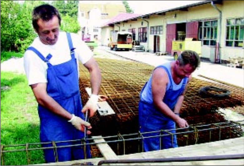
Lani je u Podravki zabilježeno 130 ozljeda na radu

- Odbori dobro funkcioniraju. Na njima obavezno prisustvuju predsjednici odbora, doktor medicine rada, stručnjak zaštite na radu, sindikalni povjerenici za zaštitu na radu, a obavezno se poziva i inspektor zaštite na radu. Kod prijavljivanja ozljeda na radu bitnu ulogu imaju neposredni rukovoditelji ozlijeđenog radnika, jer imaju obvezu popunjavanja potvrde o ozljedi na radu koju su obavezni dostaviti medicinskim sestrama. Koristimo ovdje priliku da skrenemo radnicima pažnju da kod ozljeđivanja poštuju proceduru prijavljivanja, jer nam se može dogoditi da padnemo pod utjecaj kaznenih odredbi pa čak i nepriznavanje ozljeda na radu - zaključio je Crljenica.