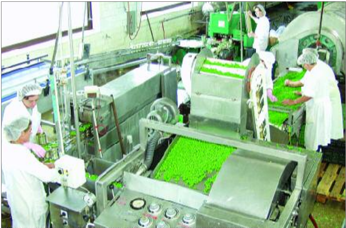
Prerada graška u Kalniku protegnula se već oko mjesec dana, ali je kvaliteta - prva liga!

- Sezona za nas završava u studenome preradom paprike, odnosno kasne cikla. Prije tri tjedna proveden je pokusni projekt navodnjavanja cikla na poljoprivrednom gospodarstvu Bajs. Postavljen je agregat koji trenutno nije u upotrebi zbog dovoljnih količina vode, a navodnjavat će se prema potrebi.