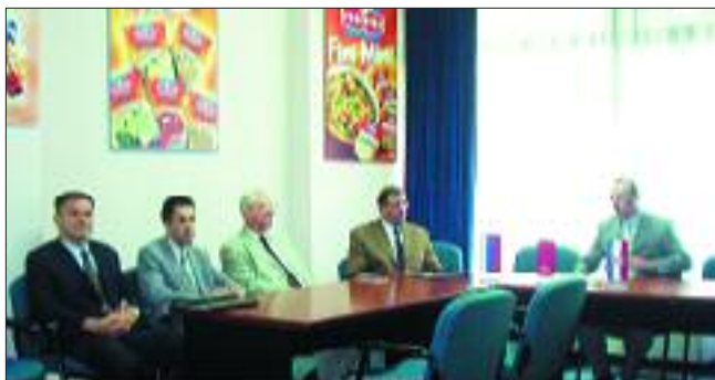
Podravku posjetili ruski ambasador u Hrvatskoj i prvi tajnik za gospodarstvo 3. str.