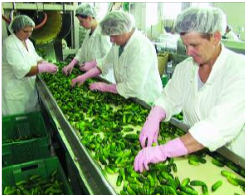
Dnevno se u varaždinskom Kalniku može preraditi i do 90 tona krastavaca

prerada započela sredinom lipnja, došlo je do podbačaja u prinosu, iako je kvaliteta bila zadovoljavajuća. Prinosi su poboljšani kod sljedećih 150 hektara i iznose četiri do pet tona po hektaru, a kvaliteta u potpunosti zadovoljava.