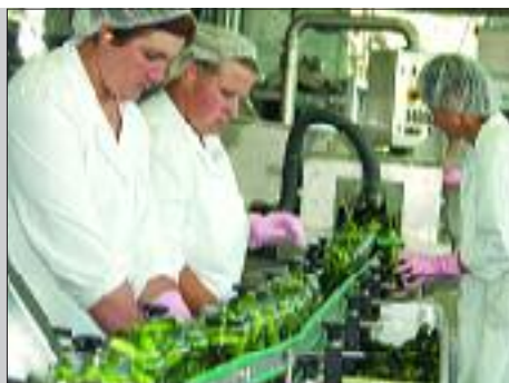
Prerada povrća u varaždinskoj Tvornici Kalnik počela uspješno 4. str.