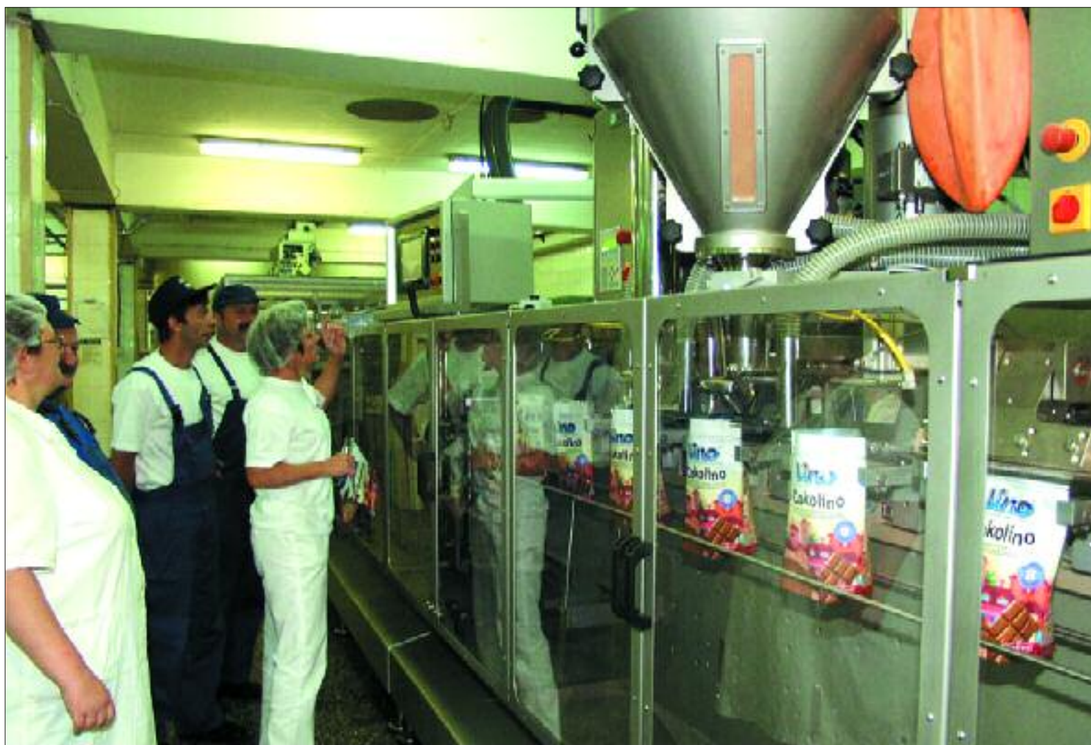
Novi stroj na Dječjoj hrani već puni kilogradska pakiranja Čokolina

Piše: Mladen Pavković