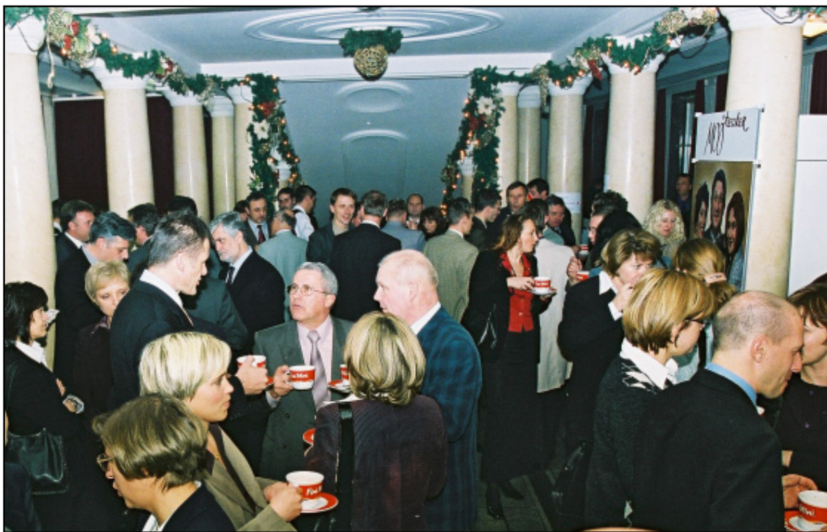
Druženje kupaca i partnera u Ljubljani proteklo je uz kušanje toplih Fini Mini "juhica"