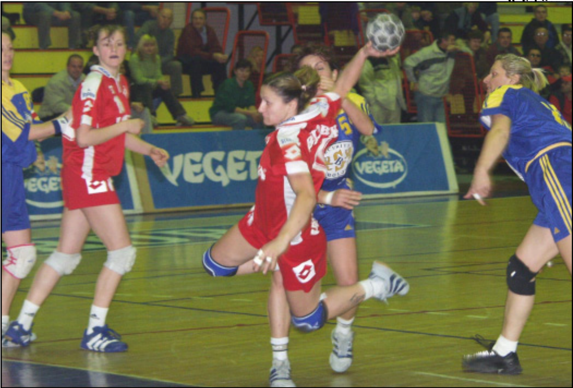
Unatoč oscilacijama u igri u pojedinim susretima, Podravkašice su uvjerljivo prve

Protiv Split Caltenberga za Podravku Vegetu su igrale: Stančin, Bračko, Vresk 2, Pensa 1, Palčić 7, Hodak 9, Raguž 2, Čuljak 4, Bilobrk, Sirovec 1, Petika, Tarle 1, Jurić 1 i Franić 1.