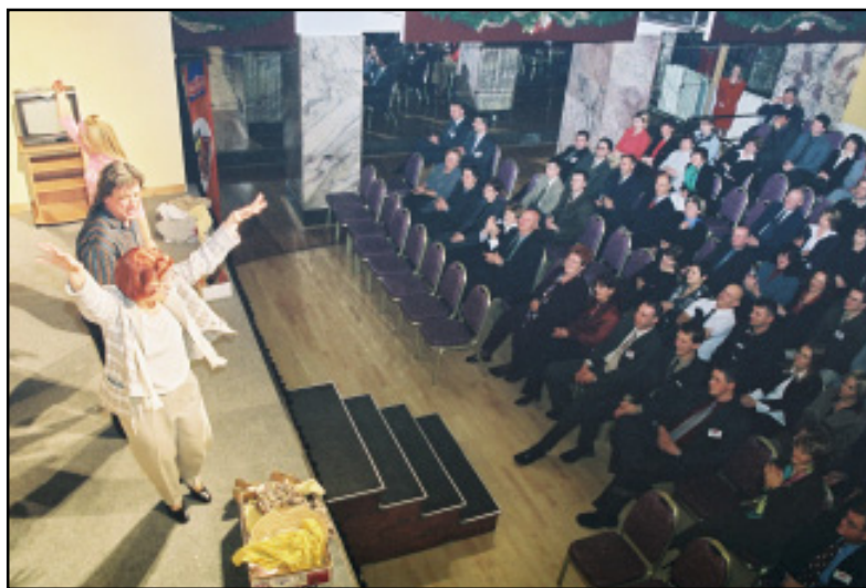
Kazališna predstava "Juhica" bila je uvod u dobro raspoloženje...