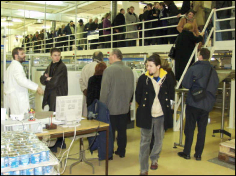
Profesori i studenti Filozofskog fakulteta bili su impresionirani proizvodnim prostorima gdje se proizvodi širom svijeta poznata Vegeta

Inače, profesori i studenti zagrebačkog Filozofskog fakulteta bili su koprivnički gosti u povodu sjednice Fakultetskog vijeća koja je održana u koprivničkom Visokom učilištu. [B. F.]