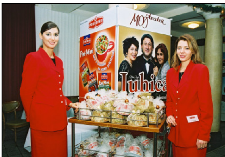
Za uzvanike su pripremljeni i prigodni pokloni - šalice i Fini Mini "juhice"