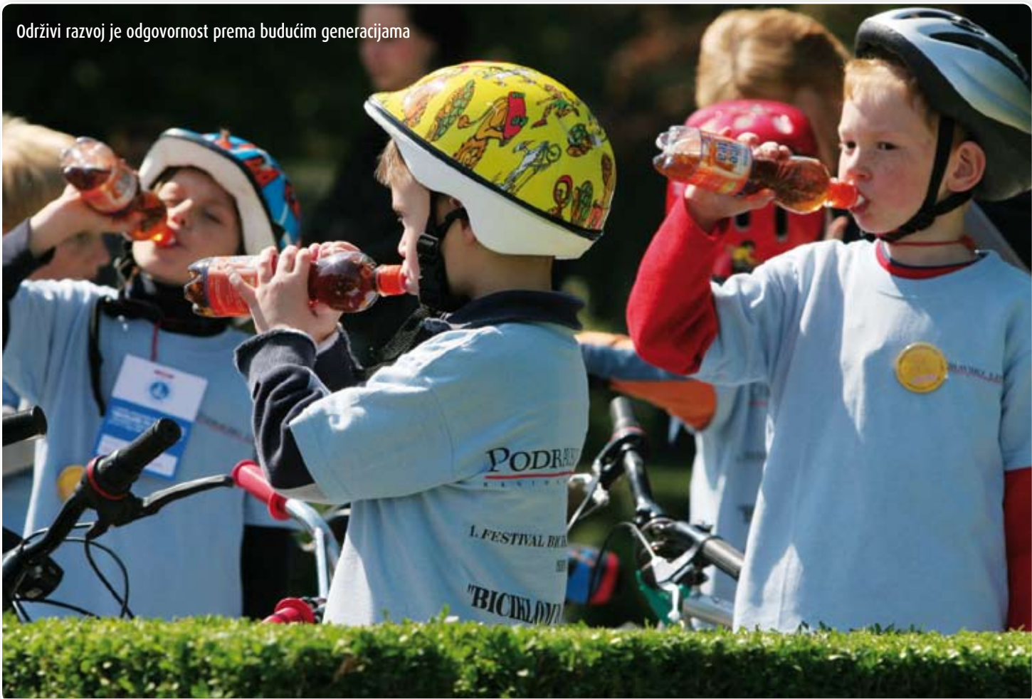
Održivi razvoj je odgovornost prema budućim generacijama

Učešće svih od velikog značaja "Obrazovanje radi održivog razvoja" ne predstavlja pučko proširenje ekološkog obrazovanja na socijalne i ekonomske aspekte, već bi trebalo da predstavlja jaku vezu između političkog obrazovanja, globalnog učenja, ekološkog obrazovanja i zdravstvenog odgoja. Cilj UN-a tako je postao ideja da se spoje različite inicijative od političkog do ekološkog obrazovanja, od globalnog učenja do mirovnog odgoja, a sve sa ci-