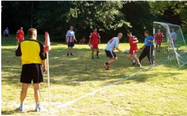
Nogomet i pokoja partija "bele" - uz zvuke tamburice - bili su glavni sadržaji druženja Belupovih zaposlenika kod Podravske kleti u Starigradu