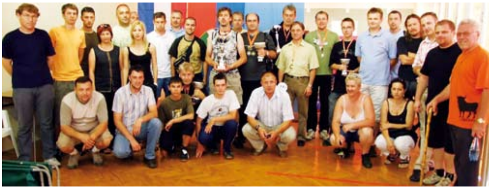
Najuspješniji sudionici Prvenstva Hrvatske u Koprivnici

Drugu godinu zaredom u organizaciji Streljačkog športskog kluba Podravka - na koprivničkoj streljani održano je Prvenstvo Hrvatske u gađanju serijskim malokalibarskim pištoljem "drulov" za seniorske kategorije. Najbolji hrvatski pištoljaši, koji su stekli rezultatske norme na županijskim kvalifikacijama, nastupili su na koprivničkoj streljani, i postigli visoke rezultate.