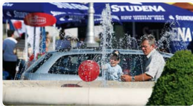
Pripremio: Vjekoslav Indir

Podravka je stekla status društveno odgovorne kompanije koja je ne samo u Hrvatskoj nego i šire poznata po stremljenju prema visokim ekonomskim, društvenim i ekološkim standardima i stoga prepoznaje značenje održivog razvoja kao vlastitu odgovornost prema budućim generacijama