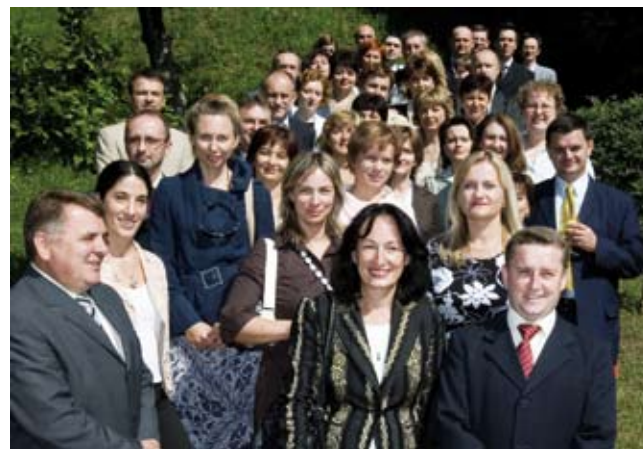
I druga je generacija uspješno završila Podravkinu menadžersku akademiju

Rezultati iza kojih stoje glasovi brojnih ispitanika u Hrvatskoj i tržištima regije za Podravku simboliziraju veliko povjerenje potrošača u Vegetu, no s druge strane, rezultati istraživanja predstavljaju i veliku odgovornost kompanije da kroz budući razvoj marke i nove marketinške koncepte opravda povjerenje naših potrošača. Ovakav rezultat istraživanja u vrlo velikoj mjeri ovisi o pozitivnom spletu visoke kvalitete proizvoda i emocionalnih iskustava koja vežu naše potrošače uz Vegetu. Na taj način potrošači su se poistovjetili s Vegetom te je ona postala neizostavnim dijelom njihovog kulinarskog umijeća, kao i kulinarske tradicije neke zemlje općenito. Dakle, priča o uspjehu Vegete može biti vrlo kompleksna, no zapravo je izuzetno jednostavna, jer uistinu "S Vegetom se bolje jede..." I. B.