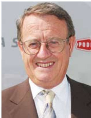
Piše: dr. Ivo Belan

Ljudski problemi često nastanu iz jednostavnog razloga što neki ljudi ne uspiju uspostaviti kontakt s drugim ljudima. Možemo primati poruke s Mjeseca i poslati svemirske sonde na Mars, ali uviđamo da nam je sve teže komunicirati s mislima i srcima onih koje volimo.