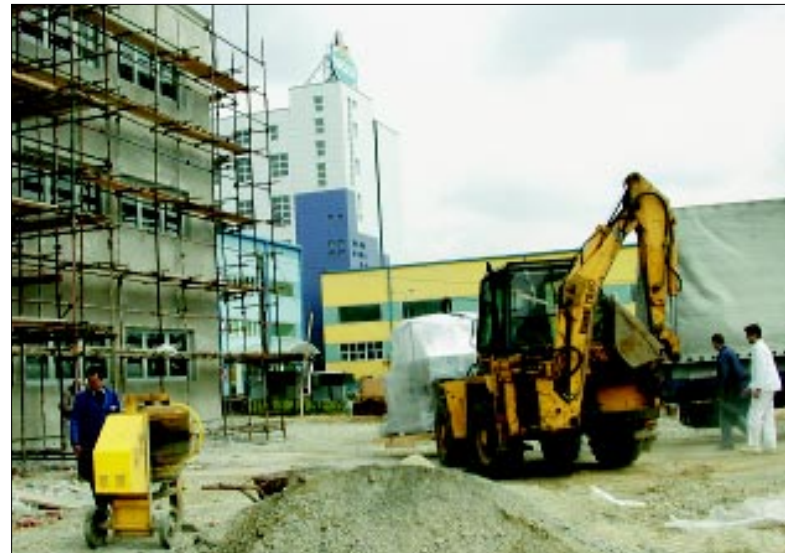
Istovar opreme za novu tvornicu

Priča o preseljenju ljudi iz stare tvornice juha u nove pogone još nije dovršena. Koncem prošle godine izvršni direktor SPJ-a Podravka jela Dragan Habić kazao je kako će se lista prelaska utvrditi prema zadanim kriterijima, a prioriteti bi bili dobri radnici, odgovarajuća stručna sprema, djeca "Podravkaša" i branitelji ili branitelji sami te socijalni moment. No, liste još nisu utvrđene. Najavljen je kako će u novoj tvornici raditi 300-tinjak ljudi, dok bi ih oko 250 ostalo u starim pogonima, preselili se u druge Podravkine tvornice ili im se, eventualno, ponudila otpremnina za odlazak iz Podravke.