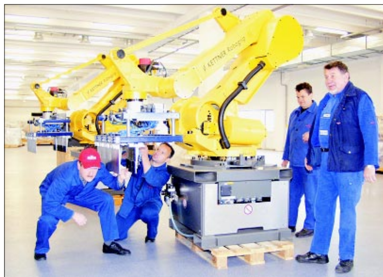
Stigli i roboti za paletiranje proizvoda