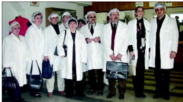
Srbijanski sindikata u Podravki