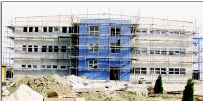
Nova tvornica Podravka jela gotova u kolovozu 3. str.