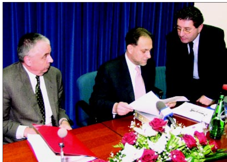
5 konferencije za novinare u Podravki

Iz obimnoga izvješća o lanjskom poslovanju Podravke još valja izdvojiti prodajnu situaciju po tržištima. Podravka u Hrvatskoj i dalje ostvaruje više od polovice ukupnih prihoda (55 posto). Sljedeće po veličini jest tržište jugoistočne Europe, na kojem se ostvarilo 19 posto ukupne prodaje, uz čak 20-postotni rast. Tržište srednje Europe (Poljska, Rumunjska i zemlje Pribaltika) treće je po veličini i važnosti, a ostvaren je pad u odnosu na 2001. godinu zbog već spomenutih problema u Poljskoj. Tržišta Češke, Slovačke i Mađarske bilježe rast, što je dijelom rezultat i akvizicije. Udjel prodaje u zapadnoj Europi i prekomorskim zemljama lani je bio šest posto, a ostvarenje je slično onome iz prethodne godine. Potencijal leži i u ruskom te ukrajinskom tržištu, gdje je zabilježen rast od 16 posto.