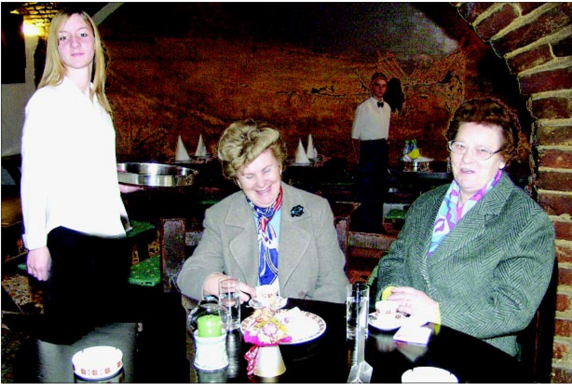
U Podravkinoj pivnici "Kraluš" - koja je ponovno uvrštena među stotinu najboljih hrvatskih restorana - posjetitelje očekuje veliki izbor podravskih specijaliteta te kvalitetna pića

Kad se ponudi dometnu pristojne cijene i ljubazno osoblje, nema razloga čuđenju zašto je nedavno Pivnica ponovno, po tko zna koji put, uvrštena među stotinu najboljih hrvatskih restorana. H. Š.