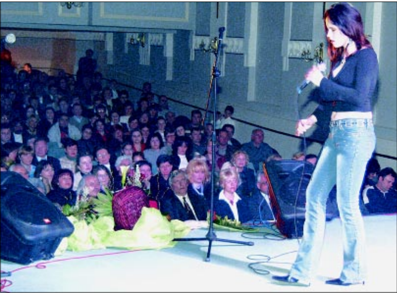
Humanitarni koncert za vukovarsku bolnicu u koprivničkom Domoljubu održan je pred ispunjenim gledalištem

- Nemam riječi kojima bih zahvalio Podravkinoj udruzi. Ona je u Vukovaru dobro znana po svojim humanitar-