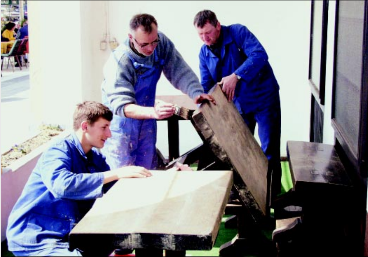
Uređenje stolova u pivnici "Kraluš"