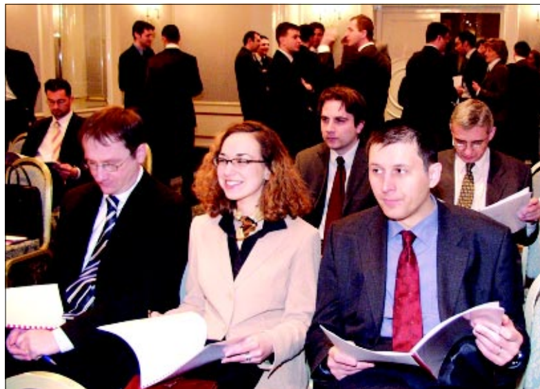
Analitičari u Zagrebu pažljivo prate rezultate poslovanja Podravke

čito je važno što se u Podravki započelo uspješno upravljati troškovima, pa su oni stoga bilježili sporiji rast od rasta prihoda i što se kroz proces dezinvestiranja kompanija uspješno okreće k djelatnostima koje donose profit. Istakli su da Podravka daje najjači doprinos hrvatskom tržištu kapitala.