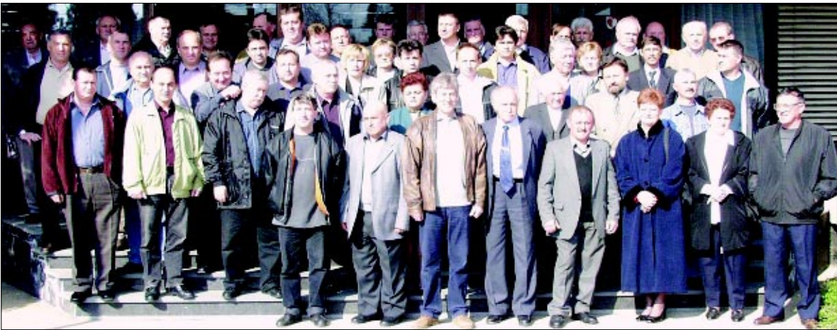
Na okupu se našao tek dio velike Podravkine obitelji dobrovoljnih darivatelja krvi

Druženje je nastavljeno zajedničkim ručkom te uz glazbu i ples!