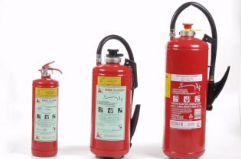
Vatrogasni aparati S- 9, S-6 i S2