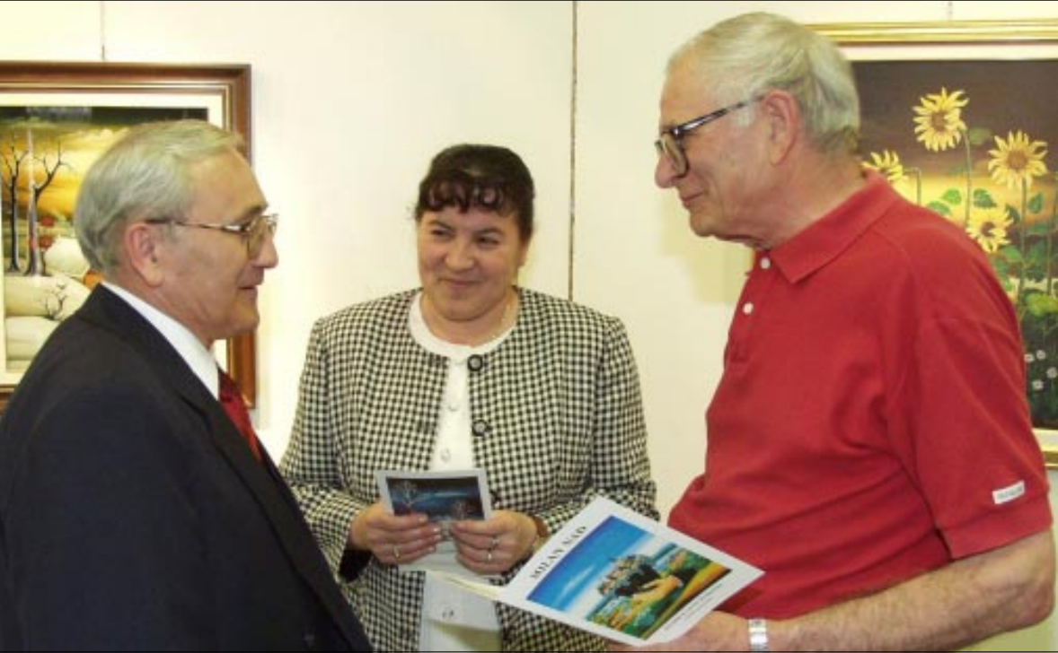
Izložba Milana Nađa u Podravki pobudila veliko zanimanje