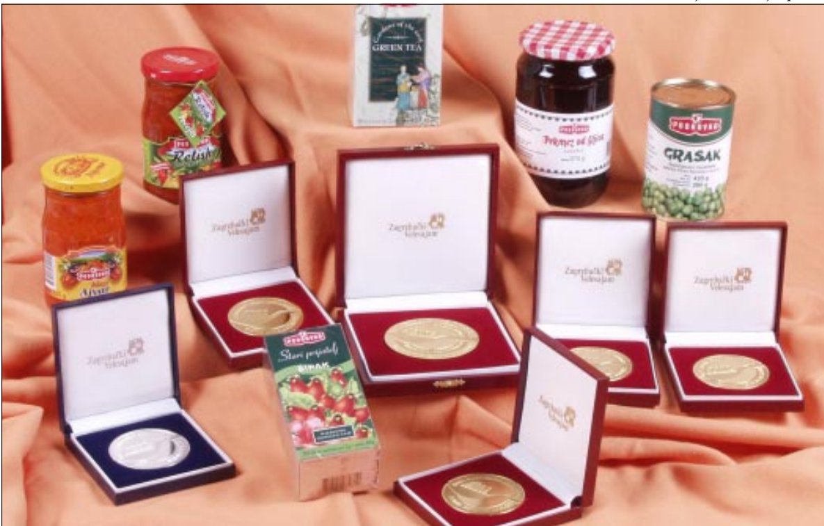
Medalje za kvalitetne proizvode

Majda Pavić prenijela nam je i zadovoljstvo svih zaposlenika u Voću kao i članova razvojnog tima zbog ponovo dobivene Zlatne medalje za pekmez od šljiva, lider proizvod duge tradicije, izuzetno kvalitetan, jer je bogat voćem - za 100 grama proizvoda utroši se 140 grama voća, pravog domaćeg okusa, koji će uskoro, nadaju se u SPJ Voće i povrće, dobiti i oznaku izvornog hrvatskog proizvoda.