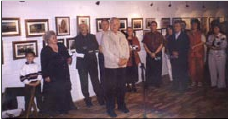
S otvorenja izložbe u Hlebinama

otvorene u Slavonskom Brodu, u okviru 10. jubilarnog Festivala domoljubnih pjesama "Brodfest", gdje će biti i održana promocija knjige "Sveto ime Vukovar" Mladena Pavkovića.