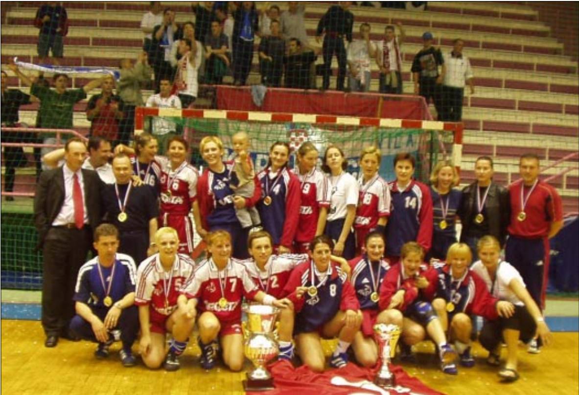
Rukometašice Podravke osvojile su i deseti Kup Hrvatske

- Slažem se s trenerom Palom. Bila je to super utakmica, prava završnica Kupa, jer ipak je to opterećenje. Samo jedna utakmica koju moraš dobiti. Bio je veliki pritisak i opterećenje na nas te smo možda zato u drugom poluvre- menu lošije igrale. No, pamtit će se da smo osvojile Kup, a ne da smo loše igrale.