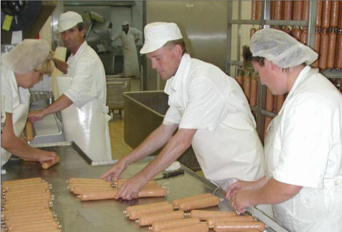
Danica je na pravom putu da postane moderna profitabilna tvrtka

Što bi na ova pitanja odgovorili hrvatski potrošači? Najvjerojatnije nešto slično, pa stoga neka naši menadžeri i ambalažeri to imaju na umu kada kreiraju ambalažu za nove Podravkine proizvode.