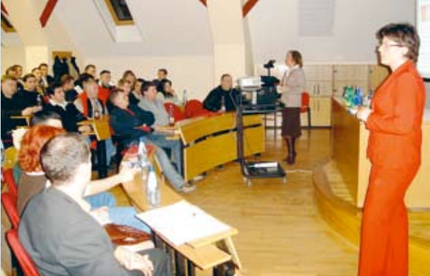
Prezentacija marketinških aktivnosti prodajnom osoblju

- Od fokusiranih aktivnosti u prvom četvrtomjesečju nagla-