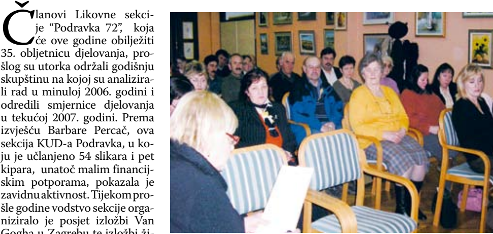
Sa skupštine Likovne sekcije "Podravka 72"