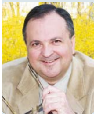
Piše: Željko Krušelj

Ustroj statističkih regija zapravo se bitnije ne odražava na unutarnje funkcioniranje Hrvatske. I dalje će presudnu ulogu imati postojeća vertikala država - županije - gradovi - općine