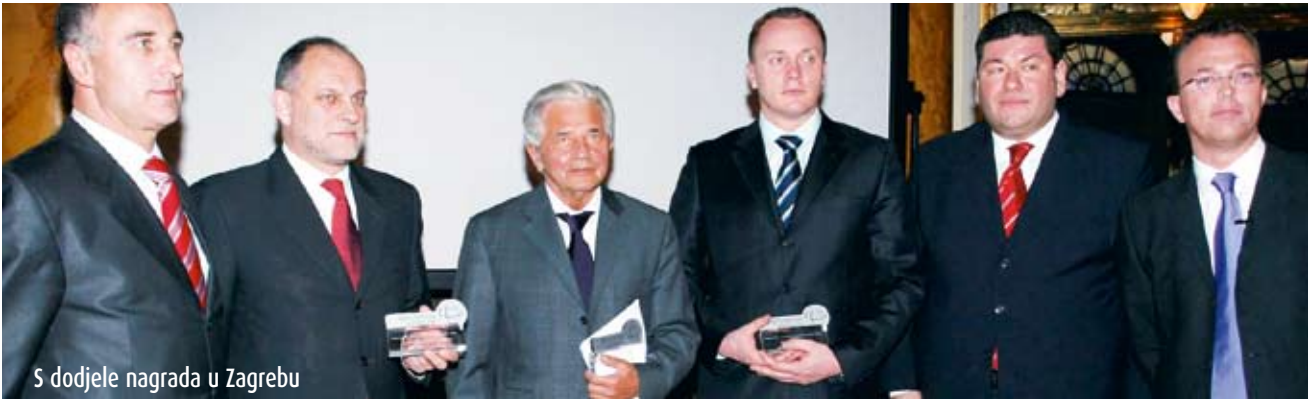
S dodjele nagrada u Zagrebu

Podravka oduvijek živi i radi na tri tržišta, a to su tržišta proizvoda, znanja i kapitala. Ključ uspjeha na tržištu proizvoda je brand, a na tržištu znanja i kapitala to je reputacija. U svojem