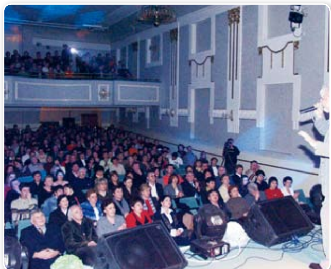
Jedan od humanitarnih koncerata u Koprivnici kojim se prikupljaju sredstva za CT uređaj