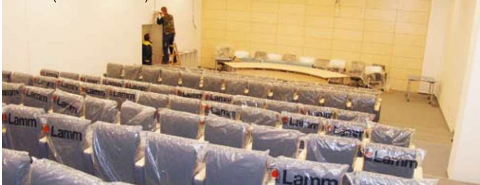
Posljednji radovi u konferencijskoj dvorani