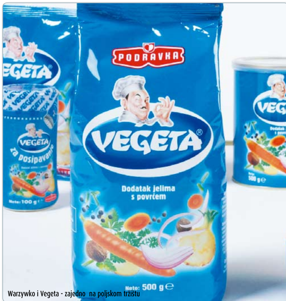
Warzywko i Vegeta - zajedno na poljskom tržištu

Uz marku Warzywko, Podravka je preuzela i Kamisovu marku za univerzalne dodatke jelima Perfectu, koja je registrirana na tržištima Rusije, Ukrajine