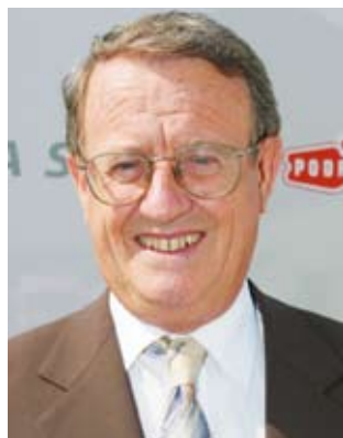
Piše: dr. Ivo Belan

A ko pijete kavu, sigurno ste već koji put pročitali u novinama ili čuli da ona može loše utjecati na zdravlje. Međutim, neke su najnovije vijesti vrlo dobre. Evo što one kažu o tome da kava može pridonijeti zdravlju i tije- la i psihe.