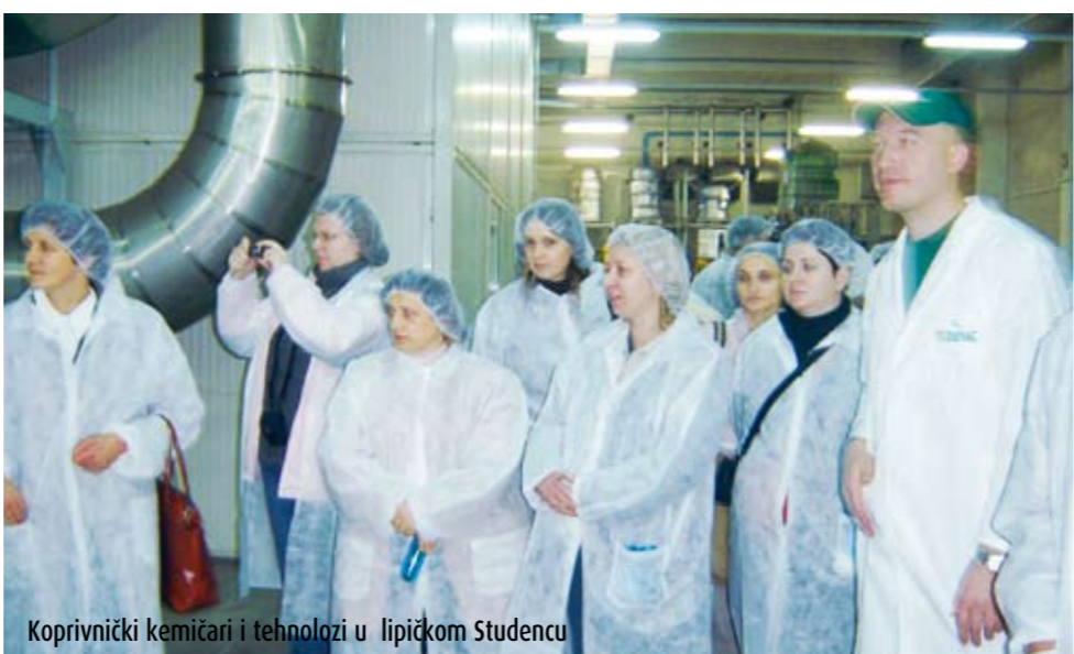
Koprivnički kemičari i tehnolozi u lipičkom Studencu

Društvo kemičara i tehnologa Koprivnica organiziralo je stručnu ekskurziju u tvornicu Studenac u Lipiku. Naši kolege, kao dobri domaćini, proveli su nas po pogonu upoznaajući nas s tehnologijom proizvodnje prirodne vode, mineralne vode, ledenih čajeva i gaziranih napitaka, nakon čega su nas odveli i na izvoršte Studene Kukanjevac, koje krasi prekrasno jezero oblika srca. Obilazak proizvodnje i izvorišta bio je veoma zanimljiv i popraćen mnogim pitanjima. Stručni dio ekskurzije bio je dopunjen turističkim obilaskom Lipika i Pakraca, koji je organizirala Turistička zajednica Lipik, i posjeta Daruvarskim toplicama, čime smo i završili svoju ekskurziju. Sanja Zagorščak