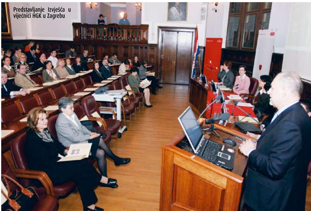
Predstavljanje Izvješća u vijećnici HGK u Zagrebu

- Okolišna komponenta detaljno je obrađena i upućuje na tradiciju praćenja podataka u segmentu utjecaja kompanije na okoliš, međutim postoje aspekti koji se mogu dodatno staviti u kontekst održivosti. Što se tiče socijalne odgovornosti, upućujem čestitke, jer je svojim utjecajem i suradnjom s lokalnom zajednicom Podravka učinila veliki korak koji potvrđuje njezino opredjeljenje. ■