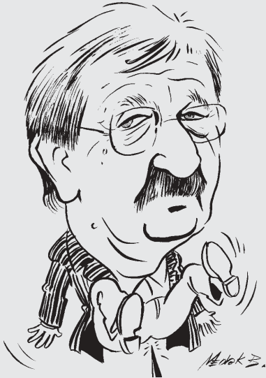
Priprema: Vojo Šiljak

Smijemo se i smijati ćemo se, jer je ozbiljnost uvijek bila prijateljica licemjera. (Foscolo) Tko se samo jednom nasmije nije nepopravljivo loš. (Carlyle)