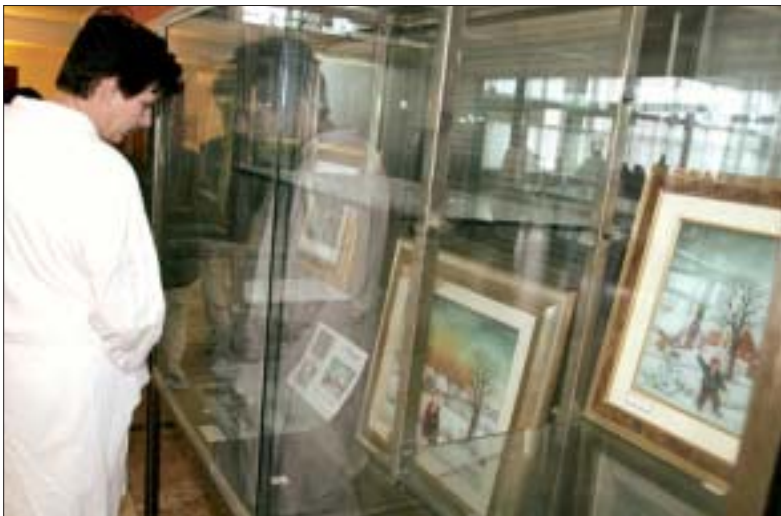
S izložbe Kolarekovih slika kod restorana društvene prehrane