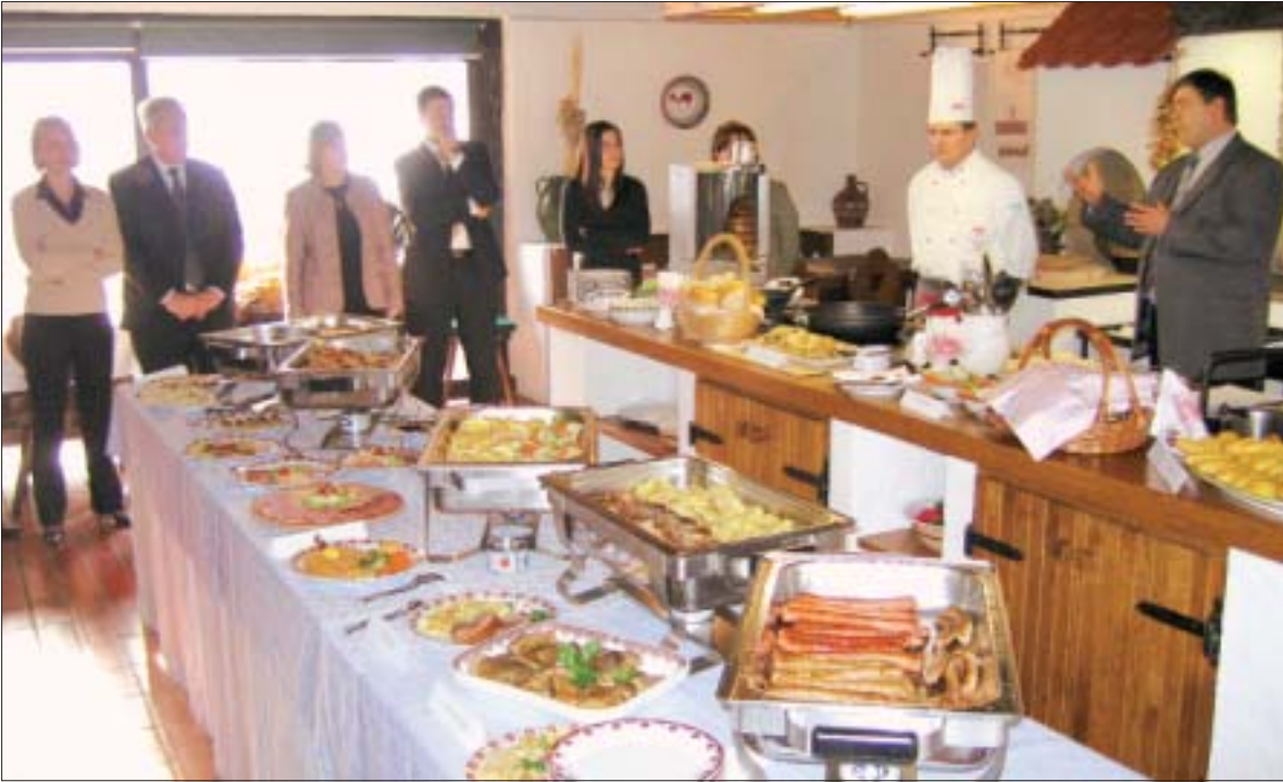
Degustacija novih jela za Pivnicu - prezentirana jela dobila su puno pohvala