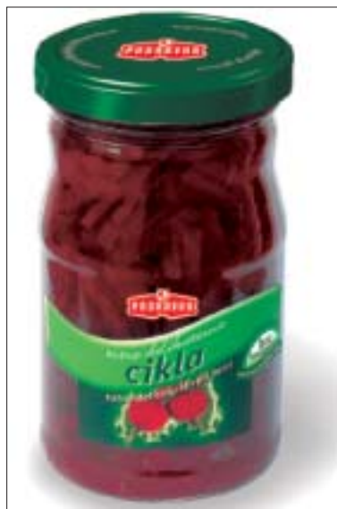
Neki od Podravkinih proizvoda od povrća u redizajniranoj ambalaži