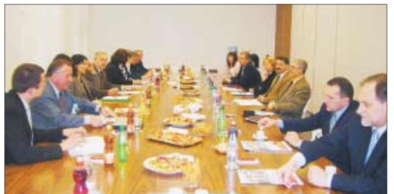
Sa 45. sjednice Upravnog vijeća Hrvatskog poslovnog savjeta za održivi razvoj

Ovaj izbor je još jedna velika potvrda i priznanje Podravki za njen dosadašnji doprinos u razvoju gospodarstva, društvene zajednice i zaštiti okoliša. Podravkina je misija poslovanje u interesu klijenata i potrošača te se u okviru Poslovnog savjeta za održivi razvoj poduzimaju konkretne aktivnosti utjecaja na postojeću zakonodavnu regulativu, razmjenu konkretnih iskustava i poticanje članica HR PSOR-a na akcije u cilju boljitka za-jednice. Povodom šeste obljetnice postojanja