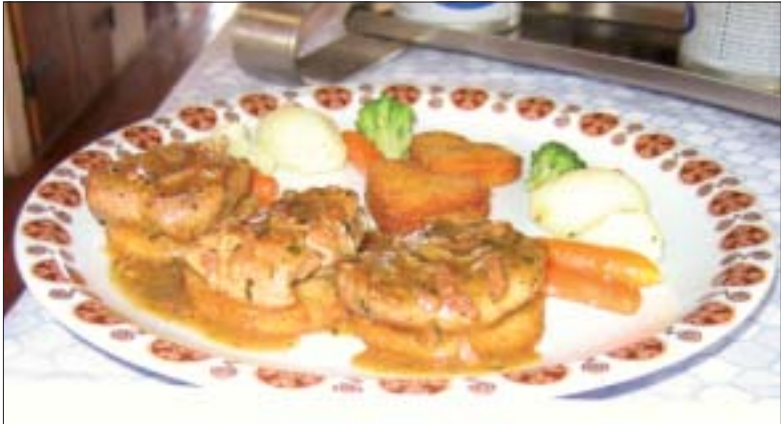
Pivski medaljoni - jedno od niza finih jela koje će se naći na jelovniku u Pivnici

Sedlanić koji je ujedno i glavni nositelj projekta izmjena jelovnika za Pivnicu i Klet. Naravno, svi pozvani na degustaciju bili su vrlo zadovoljni prezentiranim jelima, a tijekom degustacije rečeno je da kvaliteta i ljepota jela uopće nije upitna, a da bi se možda trebalo više poraditi na edukaciji osoblja u restoranu koje bi gostima trebalo znalački i stručno preporučiti upravo ova jedinstvena jela podravskoga kraja.