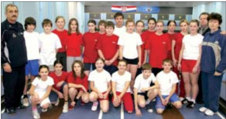
Rasadnik budućih izdanaka koprivničkog kuglanja

Kuglačice Podravke u četvrtfinalu Eurolige