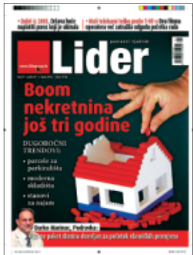
Naslovnica tjednika Lider

Iz prvog prioriteta proizlazi i naš drugi cilj - permanentno smanjivanje troškova proizvodnje u svim segmentima. Konstantno i učinkovito smanjivanje troškova po jedinici proizvoda naš je imperativ u svim tvornicama te je to cilj i zadatak kojega sam ja postavio pred sve svoje suradnike. To je na neki način glavna zadaća sviju nas koji vodimo proizvodnju i to je naš osnovni zadatak. Metode kako to postizemo već su rečene - usmjeravanje investicija na one segmente proizvodnje gdje to donosi brze i najveće efekte, potom povećanje iskorištenja kapaciteta kroz različite vidove uslužne proizvodnje gdje već imamo značajnu i kvalitetnu suradnju s respektabilnim kompanijama. Naime, neizbježni trendovi u proizvodnji svaku tvrtku koja dugoročno želi rasti na tržištu tjeraju da mora imati vrlo efikasnu proizvodnju. Da bismo to postigli moramo puno više ulagati u znanje svojih kadrova, investirati u novu opremu, povećavati stupanj iskorištenja naših tvornica na način da svagdje dostignemo "kritičnu masu" ili veličinu i potrebno je konstantno racionalizirati troškove. Ako ne ispunimo minimum navedenih uvjeta, dugoročno gledajući, mali su izgledi za preživljavanje. Iako su uvjeti poslovanja sve teži i složeniji, iskreno vjerujem da Podravka u cjelini, a time i njezina proizvodnja uz maksimalni angažman svih zaposlenih može adekvatno odgovoriti na sve izazove koji se pred nju postavljaju - rekao je na kraju razgovora Miroslav Repić.