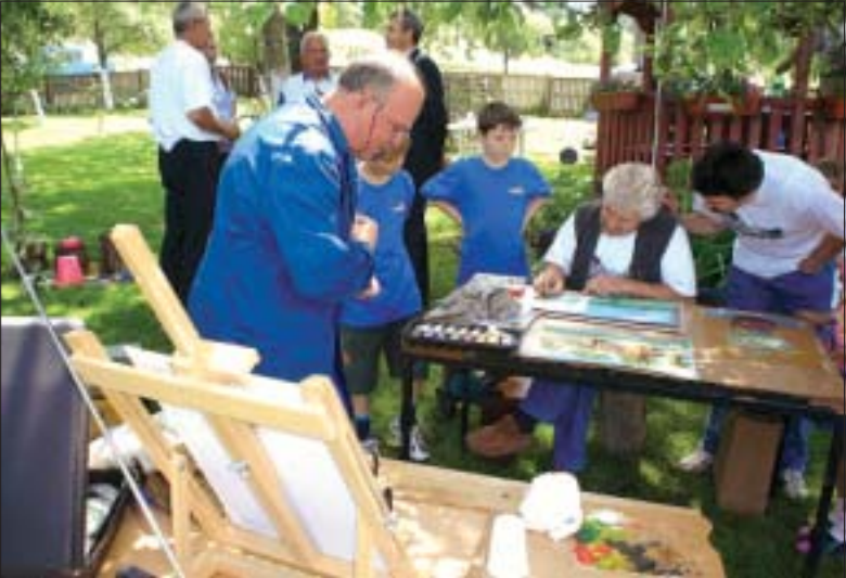
Kolonija u Bakovčicama...

Podravkini slikari prošlog su tjedna bili sudionici slikarskih kolonija održanih u Bakovčicama i Ješkovu. U petak su u Područnoj osnovnoj školi u prigradskom mjestu Bakovčice slikali u sklopu školskog kviza znanja pod nazivom "Hrvatska, moja domovina" u kojem su sudjelovali učenici iz osnovnih škola iz Iloka, Varaždina, Kalinovca, Velikog Borištota iz Austrije, i Subotice u Vojvodini. U učionici gdje se održavao kviz bila je postavljena i izložba slika Podravkine