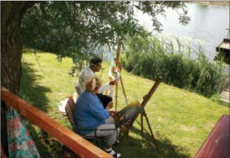
... i na Ješkovu